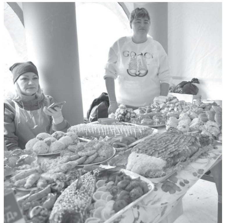
Гастрономическая выставка-дегустация «поГодная рыба»