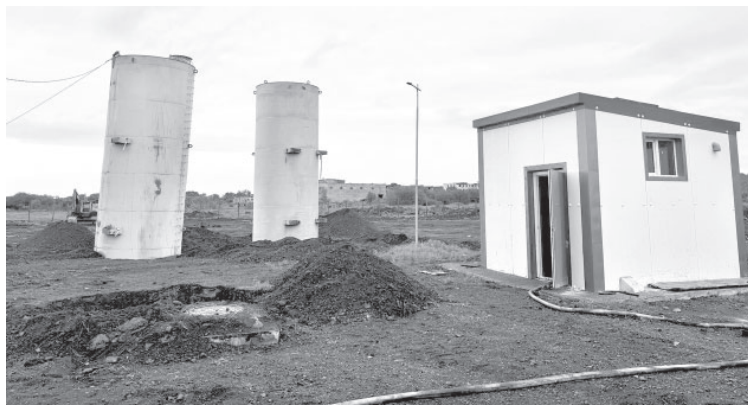
Водонасосная станция в с. Крутоберёгове

Общая стоимость всех работ на реконструкцию водоснабжения в Крутоберёгово