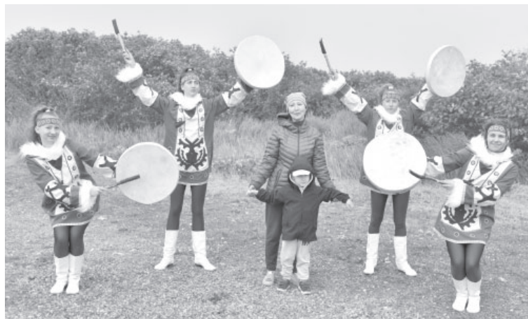
На Дне рыбака