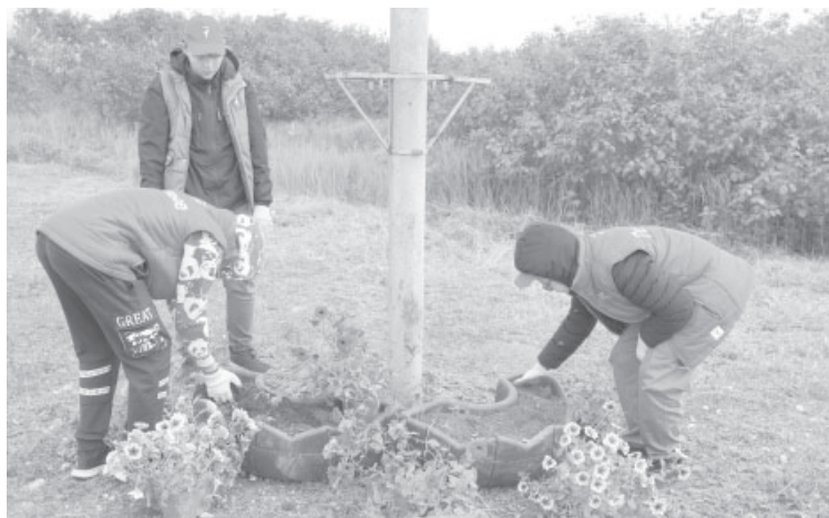
Высадка цветов на Аллее рыбацкой славы п. Усть-Камчатка

Октября в п. Усть-Камчатске появятся новые лавочки и урны, а также будет проведено освещение входа на территорию средней школы № 2 со стороны дома № 14. В Козыревске в рамках «Решаем вместе» в текущем году будет реализован инициативный проект «Обустройство хоккейной площадки», где