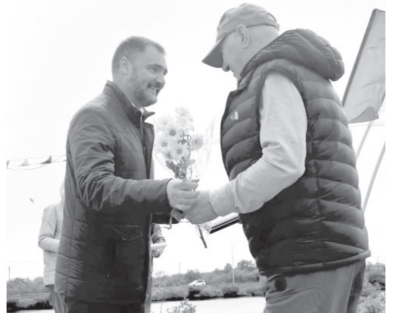
Награждение сотрудников рыбной промышленности