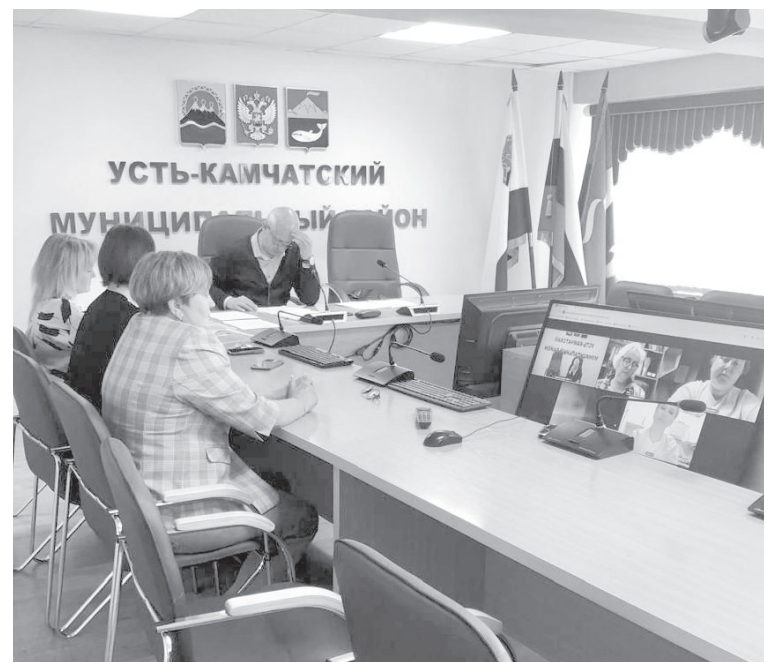
Заседание Усть-Камчатской ТИК

Полномочия главы муниципального района и глав поселе-