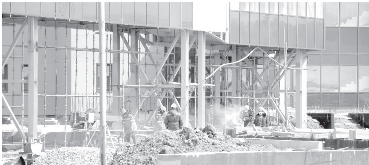
📷 Строительство Камчатской краевой больницы

Здравоохранение. Правительство России возместит более 925 млн рублей Камчатке на строительство краевой больницы.