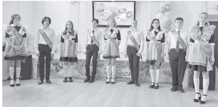
📷 Выпускники 11 класса МБОУ СШ № 5 п. Ключи-1

Выпускники вместе со своими классными руководителями подготовили выступления, в которых также были тёплые слова и добрые пожелания. Ребята подарили всем присутствующим проникновенные песни и трогательный школьный вальс. Впереди – пора