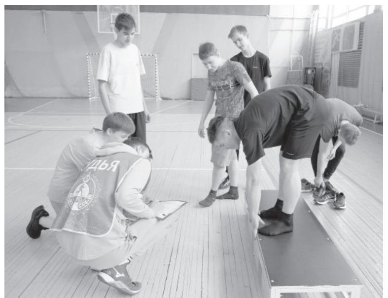
☑ День здоровья в п. Усть-Камчатке