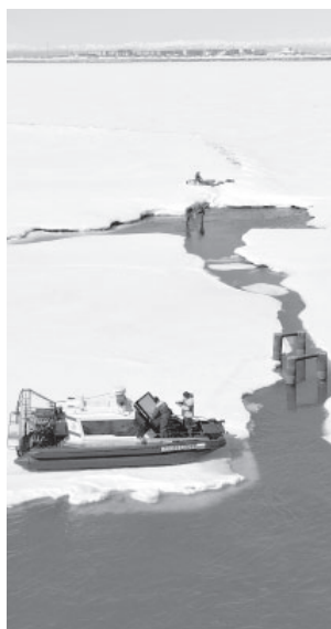
Аварийные работы на участке системы ХВС п. Усть-Камчатска

Режим повышенной готовности на сегодня действует на территории Усть-Камчатского района в связи со складывающейся паводковой обстановкой, а также локального характера в Ключевском поселении – из-за угрозы разрушения улично-дорожной сети посёлка, пострадавшей от пеплопада в 2023 году.