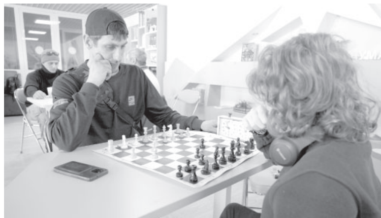
Товарищеская встреча по шахматам