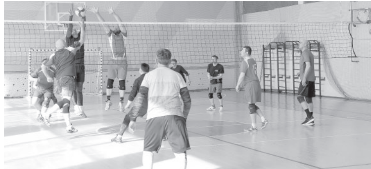
Товарищеская встреча по волейболу

День района прошёл ярко и празднично! Все, кто посетили мероприятия, покидали Усть-Камчатский Центр культуры и досуга довольными и счастливыми.