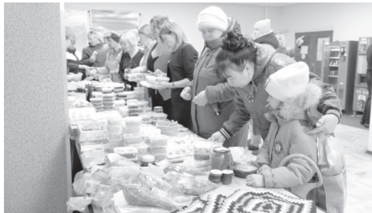
Благотворительная ярмарка «Своих не бросаем»