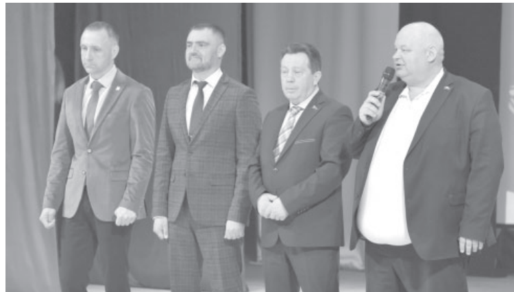
Поздравление от первых лиц района