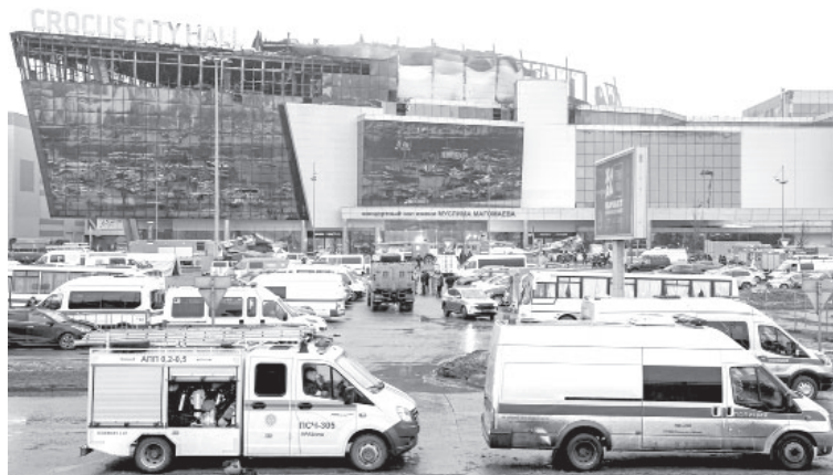
■ «Крокус Сити Холл» после теракта

Повторю, следственные и правоохранительные органы сделают всё, чтобы установить все детали преступления. Но уже очевидно, что мы столкнулись не просто с тщательно спланированным терактом, а с подготовленным и организованным массовым убийством мирных, незащищённых людей. Преступники хладно-