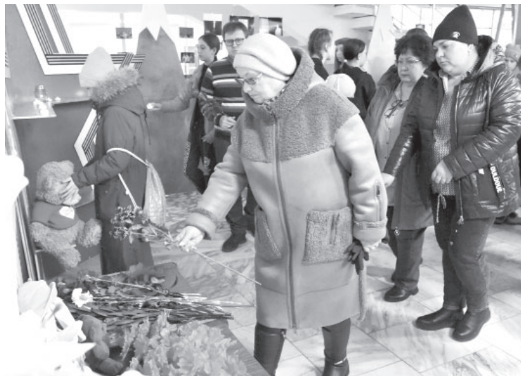
■ Стихийный мемориал в ЦКиД посёлка Усть-Камчатска

Россия не раз проходила через тяжелейшие, порой невыносимые испытания, но становилась ещё сильнее. Так будет и сейчас».