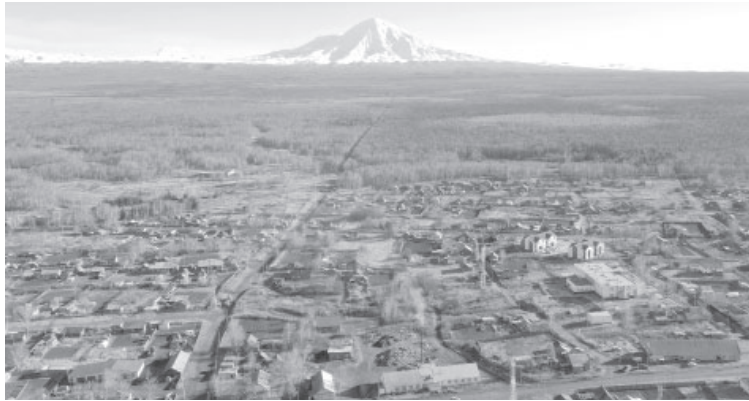
📍 Посёлок Козыревск Усть-Камчатского района

Усть-Камчатск – административный центр района – был основан осенью 1731 года. История возникновения посёлка связана с трагической страницей в истории полуострова. Из-за ясных сборов, которыми занимались русские, людям приходилось очень сложно, так как изымали у простого народа огромные налоги в виде различных ценностей. На Ильин день восставшие в 1731 году ительмены сожгли Нижнекамчатский острог. Случайно спасшиеся казаки приплыли в устье реки Камчатки, где впоследствии и появился новый населённый пункт, получивший название Усть-Камчатск.