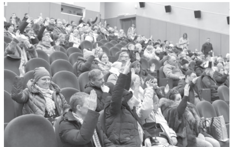
■ Голосование на публичных слушаниях в п. Усть-Камчатске

Результаты голосования на публичных слушаниях: Усть-Камчатск – из 206 зарегистрированных «ЗА» – 110 человек, «ПРОТИВ» – 58, «ВОЗДЕРЖАЛИСЬ» – 10. Никак не проголосовали 28 граждан. Козыревск – из 89 зарегистрированных «ЗА» – 72 человека, «ПРОТИВ» – 5,