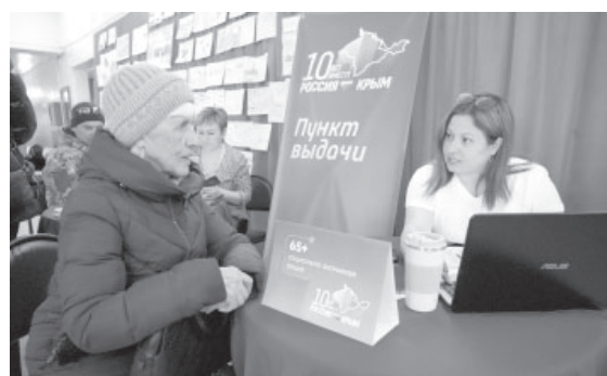
Участник акции «65+»

День воссоединения, действительно, важная дата, определяющая не только будущее России, но и будущее всего мира, которое неотделимо от российского будущего.