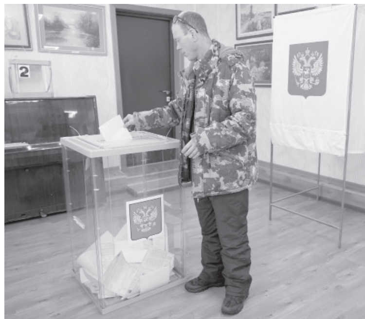
Голосование на избирательном участке № 157 п. Усть-Камчатка