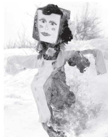
■ Сжигание чучела Масленицы в с. Майском