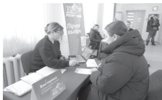
Участник викторины-розыгрыша