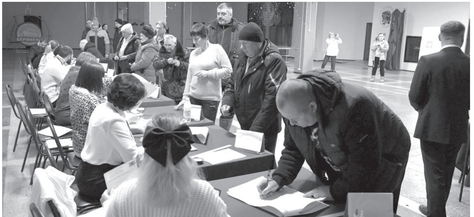
📷 Голосование на выборах президента России на избирательном участке № 156 п. Усть-Камчатска