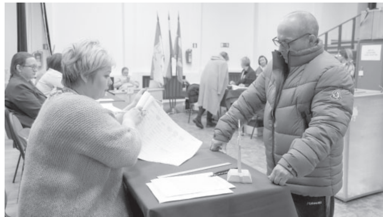
Голосование на избирательном участке № 150 п. Козыревска

Таким образом, действующий президент Владимир Путин переизбран на новый шестилетний срок полномочий (нынешний срок истекает 7 мая 2024 года). Напомним, он баллотировался в порядке самовыдвижения и при поддержке двух парламентских партий – «Единой России» и «Справедливой России».