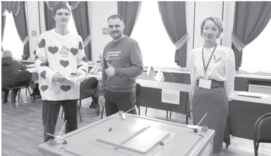
Глава Усть-Камчатского района поздравил впервые принявшего участие в выборах молодого человека

На девяти избирательных участках Усть-Камчатского района всего было 28 наблюдателей, которые следили за легитимностью голосования. Они представляли Общественные палаты от Российской Федерации и Камчатского края, а также