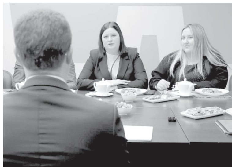
■ Встреча министра по развитию ДВ и Арктики и губернатора Камчатского края с выпускниками программы «Муравьев-Амурский 2030»