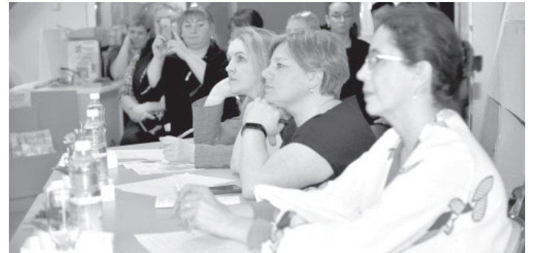
Участники муниципального этапа Всероссийского конкурса юных чтецов «Живая классика» и члены жюри