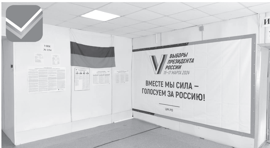
Избирательный участок № 154 п. Ключи

- Всего на территории Усть-Камчатского муниципального района образовано девять избирательных участков: два в Козыревском поселении (по одному в п. Козыревске и с. Майском), четыре в Ключевском поселении и три в Усть-Камчатском (два в п. Усть-Камчатске и один в с. Крутоберёгово).