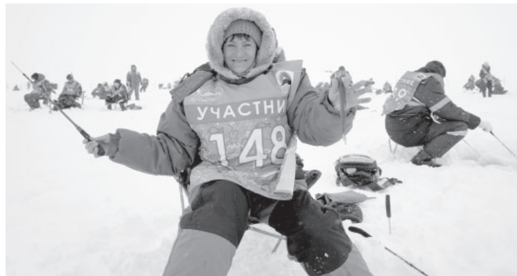
❷ Участница Фестиваля «Удача рыбака» с первым уловом