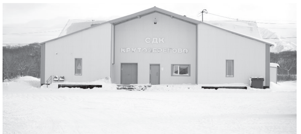
Территория под будущую установку детской игровой площадки в с. Крутоберёгово

Первое намеченное мероприятие касается обустройства детской игровой площадки в селе Крутоберёгово. Вместо демонтированной около сельского Дома