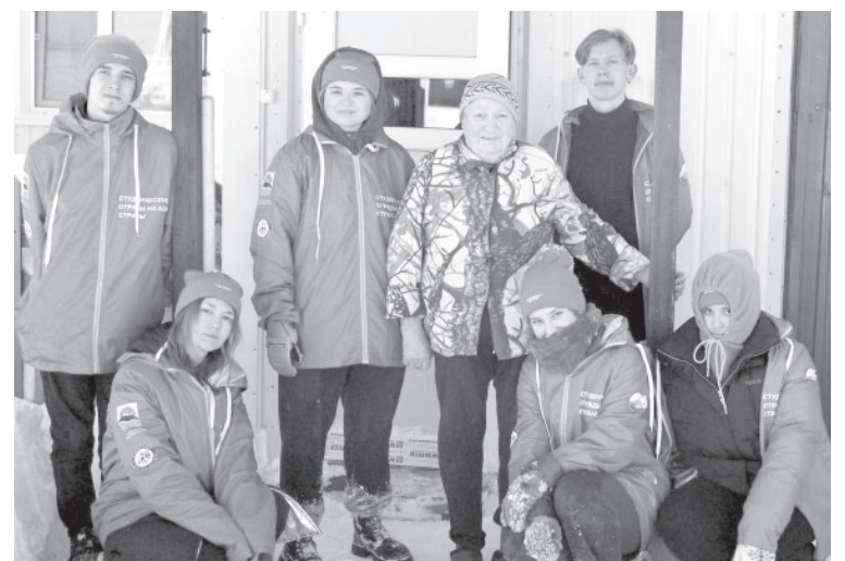
Представители «Снежного десанта»

«Эта неделя в Усть-Камчатском районе получилась очень насыщенной. Мы побывали во всех поселениях, и после каждой поездки оставались приятные впечатления. Жаль, не попали на «Удачу рыбака» из-за переноса