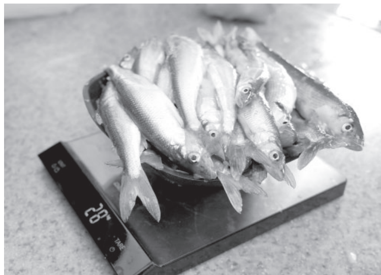
❸ Взвешивание корюшки

приз - сертификат на приобретение снегохода!