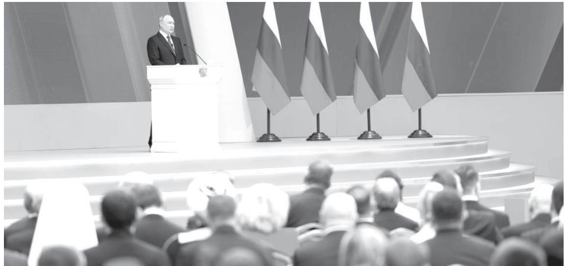
Послание Президента Федеральному Собранию

В этих условиях государство, гражданское общество, тради-