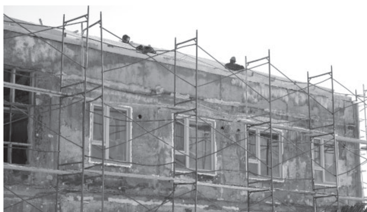
12-квартирный дом ГСК «Новые регионы»