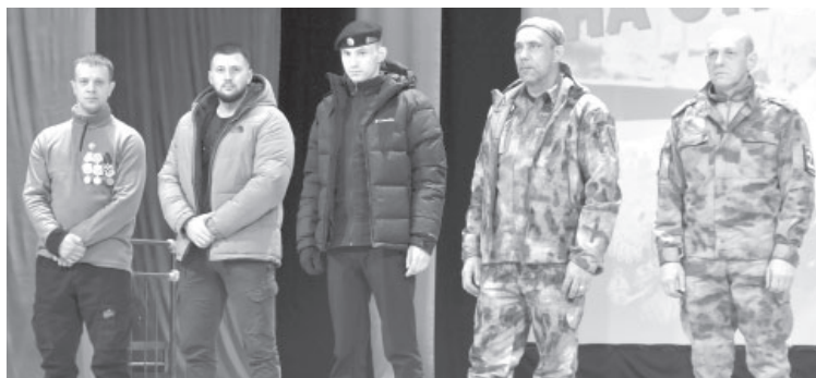
Участники СВО посёлка Усть-Камчатск

Кроме того, на мероприятии присутствовали и родственники бойцов. И каждый музыкальный номер им, как и всем зрителям, запал глубоко в сердце.