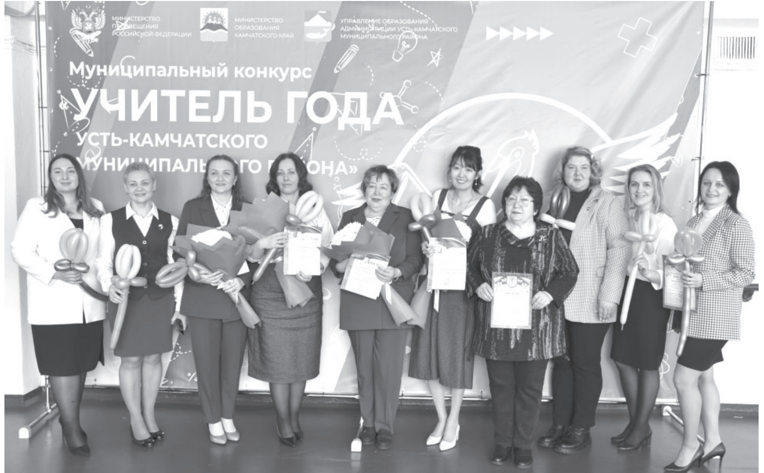
Участницы конкурса с членами комиссии

Следующими этапами были «Мастер-класс», «Разговор со школьниками» и «Пресс-конференция». Участница должны были продемонстрировать своё профессиональное мастерство и педагогический опыт. А во время пресс-конференции участницы отвечали на вопросы интервьюеров из числа ученической, родительской, профессиональной, культурной общественности. Конкурсное испытание проводилось в присутствии про-