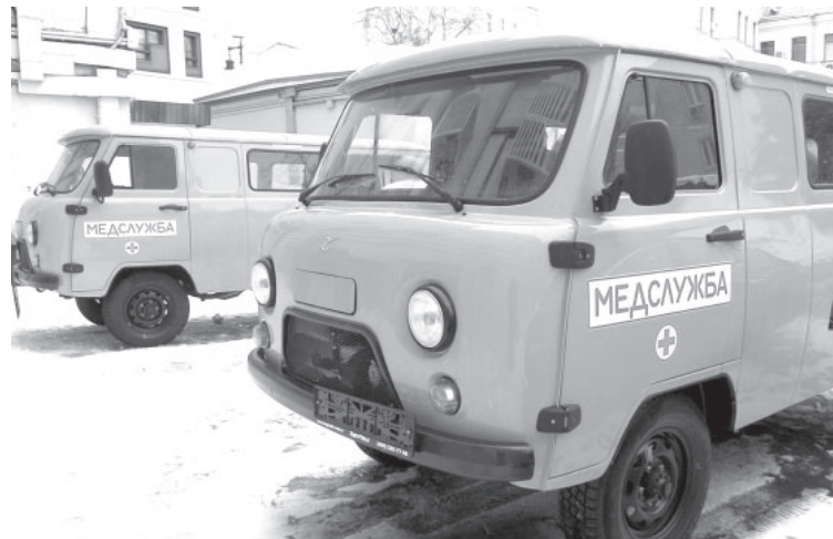
Новые УАЗы для нужд фронта

Напомним, в декабре прошлого года глава субъекта в рамках рабочей поездки в Донецкую Народную Республику лично передал участникам специальной военной операции ключи от четырёх машин и новую партию технического оборудования, которое приобрели по запросу военнослужащих 40-й бригады морской пехоты, а также 164-й и 110-й мотострелковых бригад.