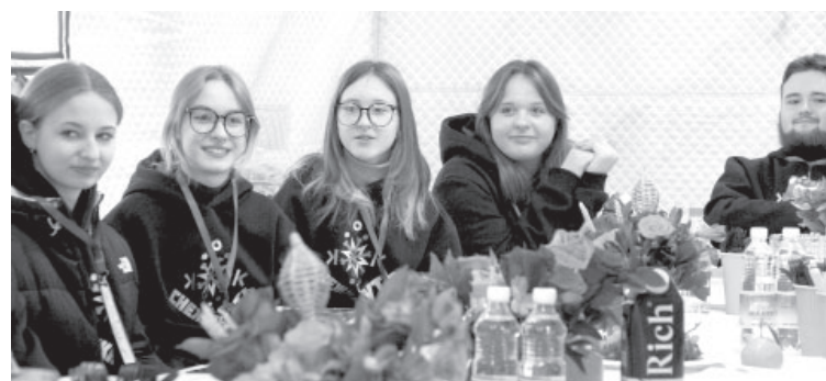
Школьники из г. Светлодарска ДНР

«Снежный путь» проходит в праздничный день — мы поздравляем наших защитников, мы поддерживаем их. Конечно, особенно поддерживаем тех, кто сегодня