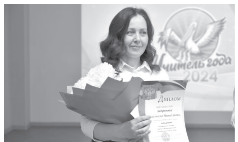
Победительница конкурса «Учитель года - 2024»