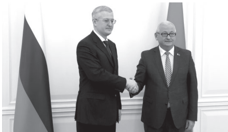
Губернатор Камчатки Владимир Солодов и премьер-министр Беларуси Петр Пархомчик

Губернатор Камчатского края добавил, что правительство региона совместно с коллегами из Республики Беларусь будет прорабатывать вопросы размещения портовых мощностей и возможности развития логистических центров. Глава субъекта также отметил, что Камчатский край заинтересован в поставках продукции сельского хозяйства из Беларуси.