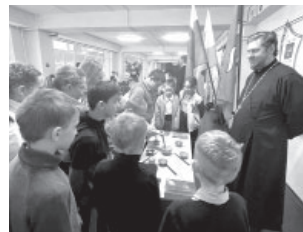
Встреча с учениками СШ №2 п. Усть-Камчатска

«Так, зная любовь вл. Нестора к кроссвордам, мы предлагаем ребятам разгадать кроссоловлицы, посвящённые содержанию нашей экскурсии. Кто больше слов отгадает, тому и приз», - отметил один из организаторов выставки. После этого священнослужители отправились в ключевскую среднюю школу № 4, № 5, а завершили командировку по району в Усть-Камчатске. Для учащихся были проведены просветительские лекции о митрополите Несторе, а также мероприятия и конкурсы. В каждом поселении находились школьники, которые проявляли живой интерес и задавали батюшкам интересные вопросы. Выставка является совместным проектом Петропавловской и Камчатской епархии, прихода святителя Николая Чудотворца и Камчатской краевой библиотеки имени Крашенинникова.