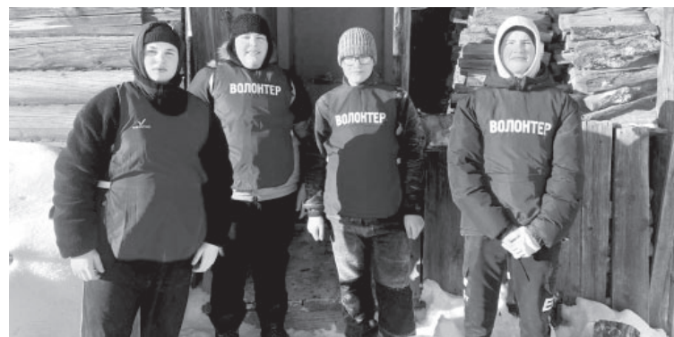
Волонтеры посёлка Козыревск

В школе № 4 п. Ключи и школе № 5 п. Ключи-1 проходят акции «Посылка солдату» и «Подарок солдату». Участие принимают как учащиеся, так и педагоги.