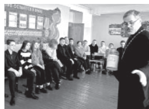
Встреча с учениками СШ №4 п. Ключи