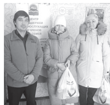
Акция в Усть-Камчатске

Обучающиеся дополнили свои посылки письмами, в которых выразили свою благодарность за службу и защиту нашей Родины, за мир и покой в нашей стране. Пожелали отлич-