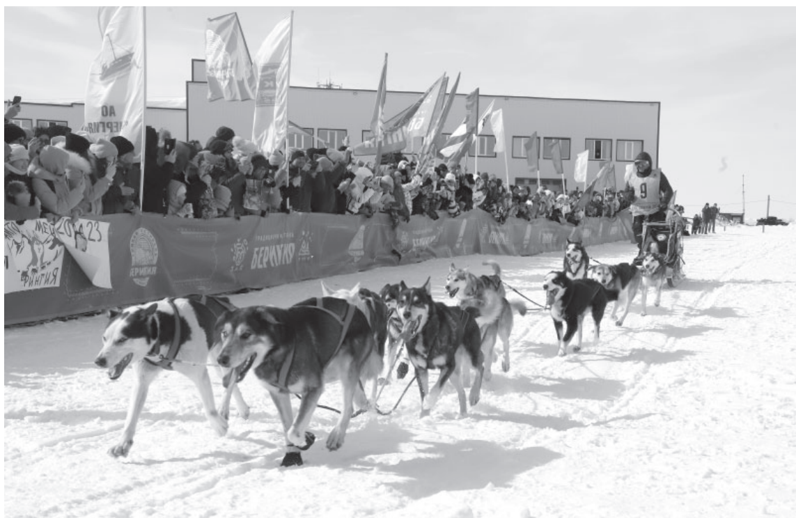
Финиш «Берингии-2023» в п. Усть-Камчатске

Туристу, решившему посетить Камчатский край в феврале-марте, следует обязательно