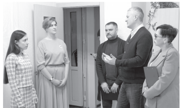
Посещение Комплексного центра и фонда «Защитники Отечества» в п. Ключи

Так, будет заасфальтирована дорога до воинской части и ключевые улицы, которые ведут к социальным учреждениям — к школе и детскому саду.