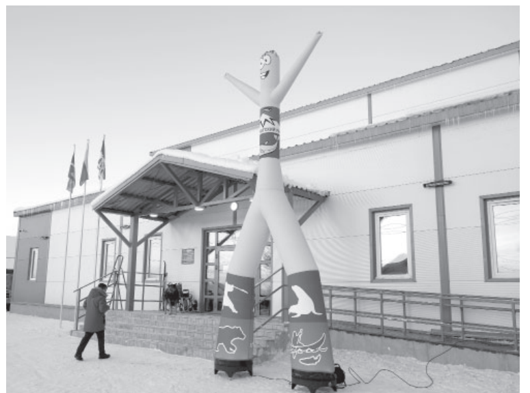
Спортивный комплекс в день открытия

Нам необходимо внести изменения в лицензию, а в остальном всё готово для начала деятельности спортивного зала в новом здании и принятию и детей, и взрослых! – пояснила директор