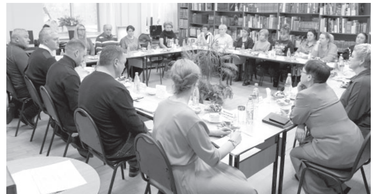
Встреча с родственниками участников СВО в п. Ключи

также осуществлять взаимодействие с районной администрацией, и с администрацией посёлка и, конечно, с представителями Минобороны РФ. Значимый вопрос, который затронули участники встречи, — обеспечение жильём военнослужащих. Договорились, что представитель Минобороны, ответственный за жилищную политику, проведёт в ближайшее время встречу, чтобы эти вопросы разьяснить и объяснить особенности различных программ, которые существуют и то, как участники специальной военной операции могут в них участвовать», — сказал глава региона.