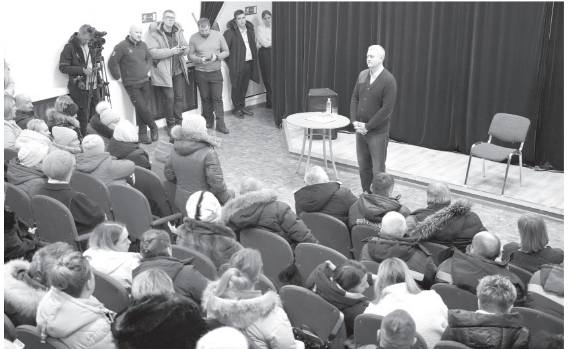
Встреча с жителями в п. Козыревске

«Здесь работает социальный координатор, и в последующем он будет выходить на семьи участников специальной военной операции и фиксировать те индивидуальные вопросы, которые поступают, а