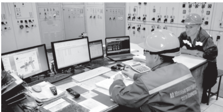
Усть-Камчатский РЭС АО «ЮЭСК»

Дизельная электростанция в Усть-Камчатке входит в состав Усть-Камчатского района электросетей. Введена в эксплуатацию в 1974 году, в состав АО «ЮЭСК» принята в июле 2001 года. В 2014 году в Усть-Камчатке введена в эксплуатацию ветроэнергетическая установка француз-