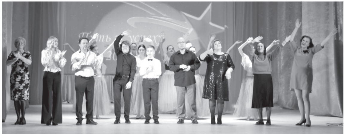
Участники церемонии награждения «Путь к успеху»

Коллектив художественной самодеятельности «Малышарики» ПДЦ «Ракета» п. Козыревска создан в 2019 году, и на сегодняшний день его участникам не более 13 лет. За время существования коллектива было поставлено порядка 100 номеров художественной самодеятельности. На их счету не только песни и танцы, но и театральные постановки. Репертуар этого коллектива художественной самодеятельности наполнен номерами как традиционных, так и современных направлений, он ориентирован на двустороннее культурное воспитание детей поселка. В 2023 году коллектив художественной самодеятельности «Малышарики» успешно принял участие во II Международном многожанровом конкурсе-фестивале «ТРИУМФ на ЮЖНОМ ПОБЕРЕЖЬЕ» и стал лауреатом первой степени и лауреатом второй степени.