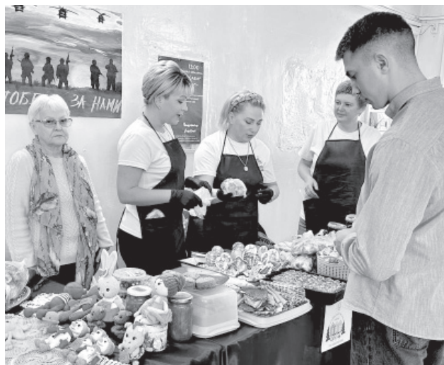
Благотворительная ярмарка