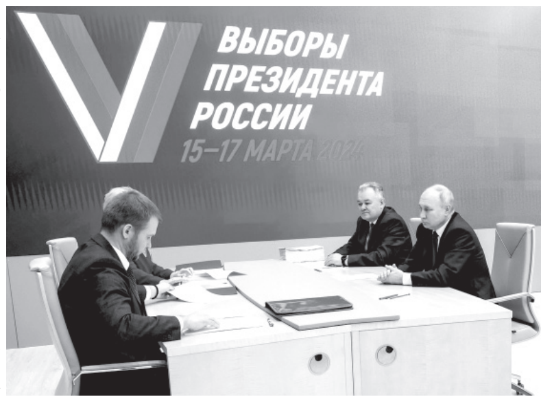
Владимир Путин подаёт документы в ЦИК

«Партия «Единая Россия», как партия власти, реализует ключевые решения, в том числе те, которые были приняты Президентом РФ, Правительством РФ, и которые на деле отвечают за результаты, поэтому здесь обсуждались не какие-то долгосрочные целеполагания или абстрактные задачи, а конкретный результат этой работы. Особый акцент был сделан на работу первичных отделений, работу на «земле», максимально приближенную к людям, доступность общественных приёмных партии «Единая Россия» и всю ту работу, которая проводится по реагированию на пожелания и чаяния избирателей – наших граждан. Надо сказать, что работа, которая была проведена, в корне позволила изменить социальную сферу: построены десятки школ, у нас на Камчатке тоже целый ряд объектов завершён, в том числе и в сфере образования. Активно идёт модернизация первичного звена здравоохранения, также мы реализуем программу социальной газификации, которая позволяет подключить индивидуальные жилые дома к газовому отоплению, более дешёвому и удобному. В целом, подводя итоги заседания, Дмитрий Анатольевич Медведев обозначил