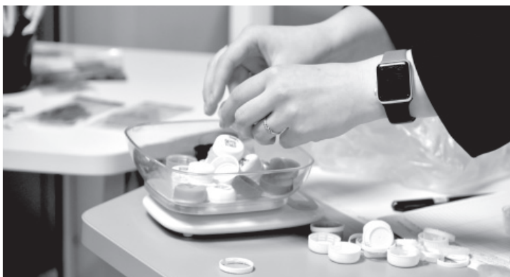
Сбор крышек

После акции каждый желающий мог принять участие в игре «ЭкоДом». Участники двух команд отвечали на вопросы, касающиеся экологии. К примеру: «Что является самым важным веществом на Земле?» или «Что нужно сделать с пластмассой, чтобы переработать её?».