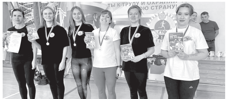
📸 Спортивные мероприятия в Усть-Камчатском районе

тор спортивного мероприятия. По итогам спартакиады первое место заняла команда «Гранит». Серебро у спортсменов «Администрации УК МР», и на третьем месте оказался «Сириус».