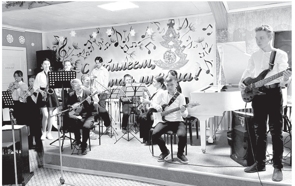
📷 Концерт в честь юбилея