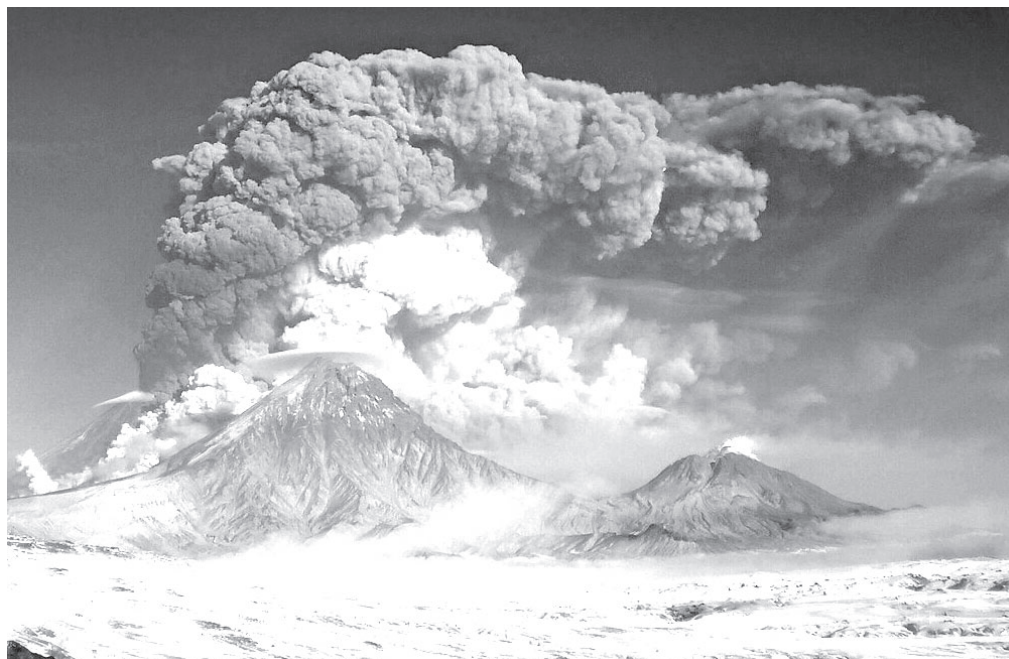
📷 Вулкан Ключевской

Первого ноября прогнозировалось выпадение пепла в посёлках Ключи и Усть-