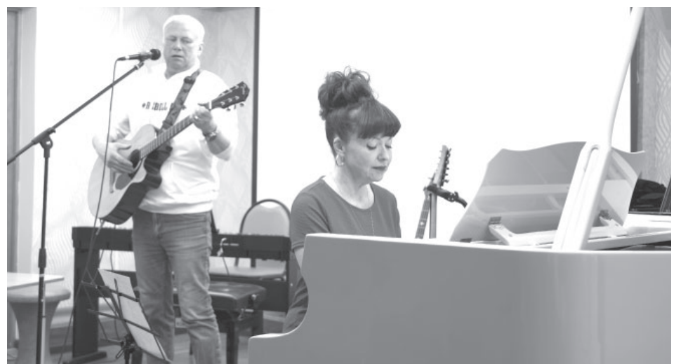
📷 Выступления коллективов «Агентства креативных идей»

двух дней коллективы дарили своё искусство жителям четырёх посёлков Камчатского края: Ключи – Козыревск – Мильково – Эссо.