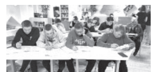
Участники этнографического диктанта

Акция проводится с 2016 года. Сегодня это уже масштабное мероприятие, в котором принимают участие наши соотечественники по всему миру. Цель – привлечь внимание людей к истории, культуре и традициям народов, населяющих нашу страну. По завершению акции все участники получили сертификаты.