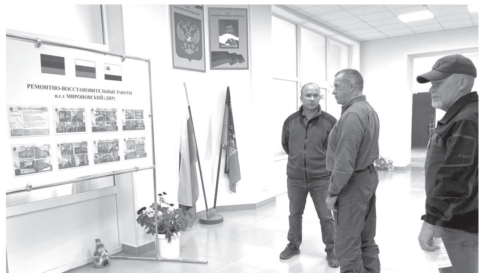
Ю. Трутнев на подшефных территориях

Организованы курсы повышения квалификации учителей истории и обществознания, мастер-классы с тренерами в различных видах спорта.