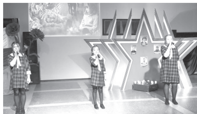
Мероприятие в п. Усть-Камчатске

Принимали участие сотрудники, дети и родители школьного и дошкольного отделений СШ №6 и члены ММО «Молодая гвардия». Все участники готовили выпечку: блины, пирожки, колобки, рогаики, торты,