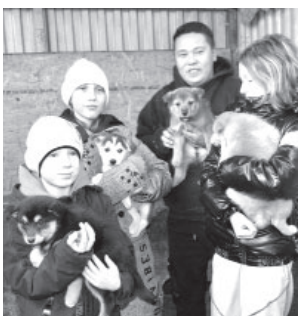
📷 Активисты РДДМ в приюте «Мохнатый ковчег»

Гости доставили корм и угощения, которые очень важны и необходимы для жизни животных в приюте. Общение с животными помогает снять стресс, а также улучшить самочувствие. Поэтому двери приюта «Мохнатый ковчег» всегда открыты для посетителей. Вы можете не только помочь кормом или лакомствами, но и пообщаться или поиграть с четвероногими.