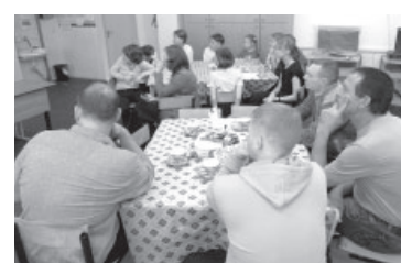
📷 День отца в Усть-Камчатске

Члены ММО «Молодая гвардия» п. Козыревска организовали и провели акцию «Папин день». Молодогвардейцы вышли на улицы, чтобы поблагодарить мужчин-отцов. Поздравительный десант вручал открытки, конфеты всем папам и дедушкам!