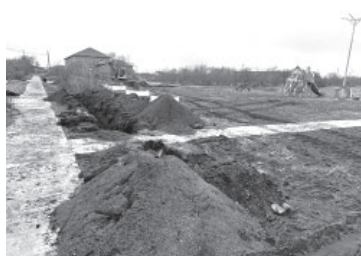
Парк им. 50-летия ВЛКСМ в мкр. Посёлок Новый