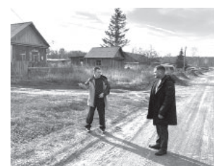
Обсуждение главой района и главой Козыревска решений по восстановлению улично-дорожной сети посёлка

- До настоящего времени юридически она до конца не сформирована, но при этом необходимо принять все меры, чтобы в Козыревск направлять выделяемую помощь, в том числе финансовую, наравне с Ключами, - отметил глава района.