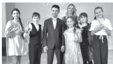
Районные участники Международного конкурса «Волшебство звука»