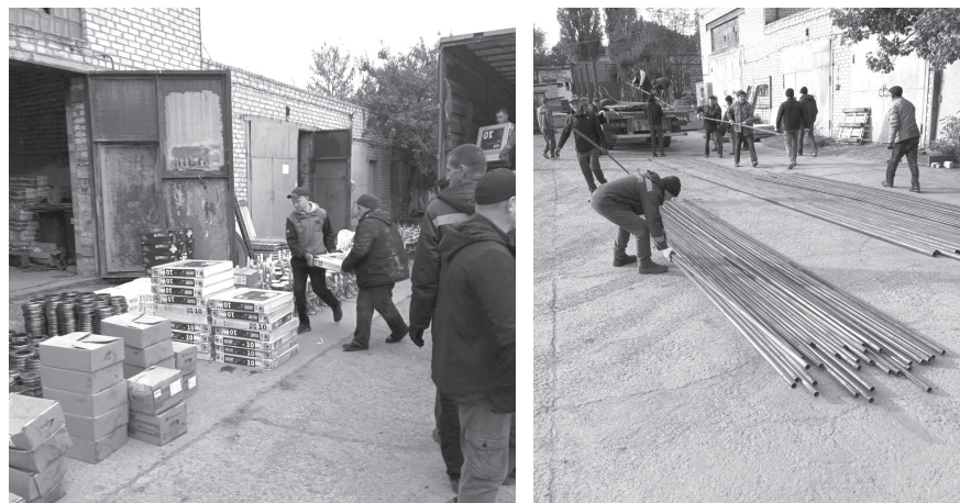
Разгрузка в г. Светлодарске гуманитарной помощи от Камчатского края / ФОТО KAMGOV.RU

kamgov.ru , официальные каналы администрации г. Светлодарска ДНР