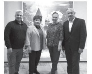
📷 Встреча с уполномоченным по правам человека