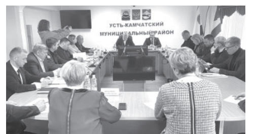
Рабочее совещание губернатора края в Усть-Камчатске

Национальный проект «Жильё и городская среда» был инициирован Президентом Российской Федерации Владимиром Путиным и поддержан Правительством Камчатского края.