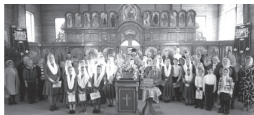
После праздничной литургии