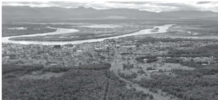
📷 Посёлок Козыревск Усть-Камчатского района, наши дни / ФОТО «УКВ»

Построена большая электростанция, на которой были уста-