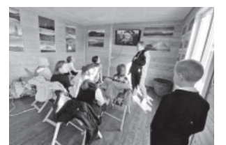
📷 Посещение ТИЦА п. Козыревска / ФОТО «УКВ»