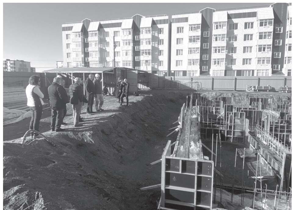
Строительство жилых домов в посёлке Усть-Камчатск