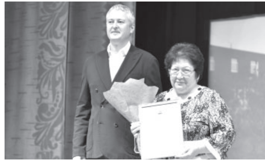
Награждение губернатором

День посёлка в Усть-Камчатске прошёл весело. Каждый гость, кто посетил мероприятия, уходил с положительными эмоциями.