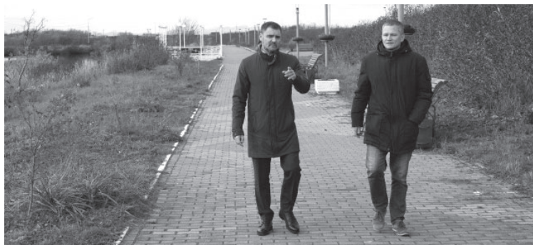
Глава района с директором службы благоустройства УКСП на аллее Рыбацкой славы

- Вынужден констатировать абсолютно халатную работу под-