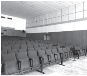
📷 Центр досуга и культуры п. Ключи

Завершение работ планируется до конца октября. Ранее в учреждении завершился капитальный ремонт крыши здания: замена кровельного покрытия прошла летом этого года согласно срокам контракта. Проект «Культурная среда» направлен на увеличение к 2024 году количества посещений организаций культуры путём создания современной инфраструктуры для творческой самореализации и досуга населения.