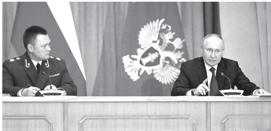
В. В. Путин на заседании коллегии Генпрокуратуры

которые ещё не завершили службу в рамках данной военной операции.