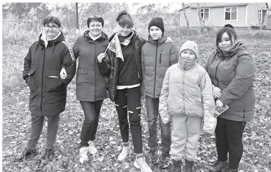
Семьи усть-камчатских участников СВО

Согласно изменениям, внесённым в закон, в качестве получателей земельных участков – членов семьи участника СВО, погибшего в ходе специальной военной операции, – будут рассматриваться не только супруги, но и родители, и дети. Также возможность получить участок появится у военнослужащих СВО,