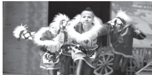
Праздничный концерт