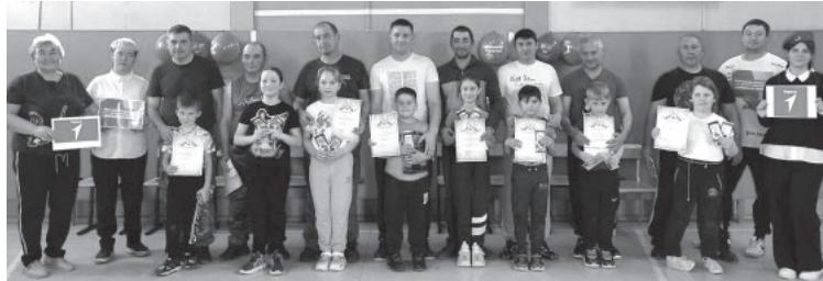
📷 День отца в Козыревске