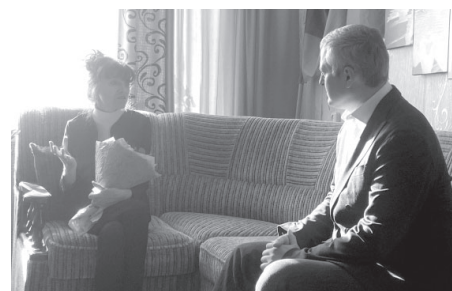
Встреча губернатора Камчатского края Солодова с матерью участника СВО

Отметим, по поручению губернатора Камчатского края Владимира Солодо-