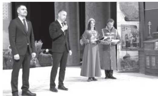
Поздравление главы Усть-Камчатского района и председателя Собрания депутатов УКСП