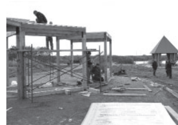
Строящаяся зона отдыха в мкр. Погодном

рядчика, каких-то продвижений вперёд пока нет. Мало того, что сроки контракта по устройству системы освещения давно нарушены, так ещё согласно выбранному способу укладки кабельной линии – подземному (и это правильно) – работники накопили траншеи, которые не огорожены и таким образом создают условия для возникновения несчастных случаев, - возмущён Олег Сергеевич.