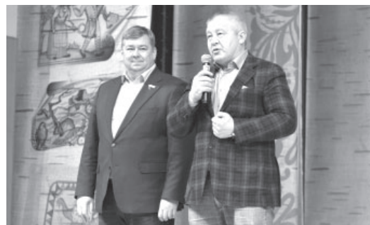
Поздравление краевых депутатов