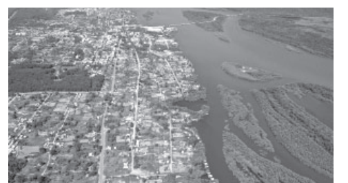
Посёлок Ключи