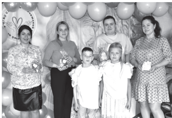
Участники мероприятия в честь Дня беременных в п. Усть-Камчатске

Седьмого октября в Усть-Камчатске, девятого в Козыревске, а десятого и в Ключах сотрудники Комплексного центра социального обслуживания населения провели познавательные мероприятия, посвящённые Всероссийскому дню беременных. Впервые данная акция была проведена в 2022 году.