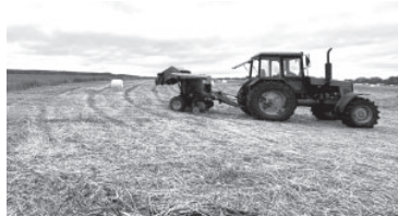
■ Заготовка сенажа ООО «Крутоберёгово»

Около дома на ул. Аэрофлотской подрядчик завершил установку новой площадки ТКО. Нараеканий к качеству у главы района не возникло, зато нашлись замечания по чистоте прилегающей местности. После указаний работники службы благоустройства навели там порядок.