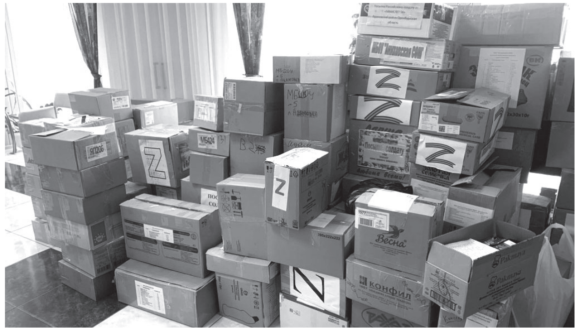
📦 Посылки для военнослужащих

Любое почтовое отделение АО «Почта России». Телефон для справок: + 7 (4152) 42-50-41