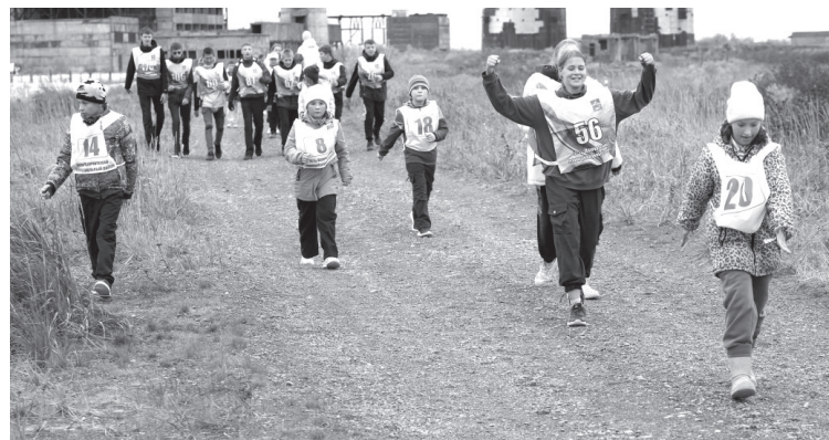
Всероссийский день ходьбы в п. Усть-Камчатске

У всех участников мероприятия было отличное настроение. Победителей категорий в соответствии с результатами награждали медалями и грамотами!