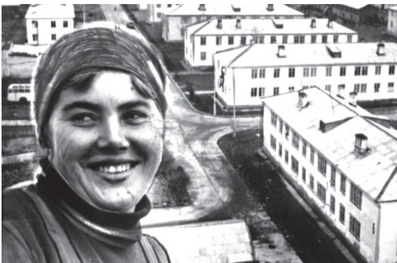
Иллюстрация из газеты «Ленинский путь» / ФОТО ИЗ АРХИВА В. БОРИСОВА

1973 год – третий год пятилетки. Всё то, что недоделали