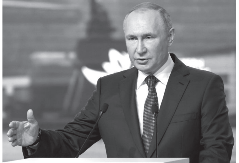
Президент России Владимир Путин

С сентября 2020 года у жителей Магаданской области и Чукотки появилась возможность оформить кредит по ставке 2 % годовых, покупая жилье на вторичном рынке. Осенью 2021 года дальневосточную ипотеку расширили на вторичное жилье в моногородах Дальневосточного федерального округа. Таких здесь 34 с населением более 630 тыс. человек. «Как правило, это населённые пункты, построенные при градообразующем предприятии: Новошахтинск в Приморье, Краснокаменск в Забайкалье, Чегдомын в Хабаровском крае. Молодых семей в таких моногородах насчитывается порядка 26 тыс., многие из них заинтересованы в использовании дальневосточной ипотеки для улучшения жилищных условий», – пояснил министр по развитию Дальнего Востока и Арктики Алексей Чекунков.