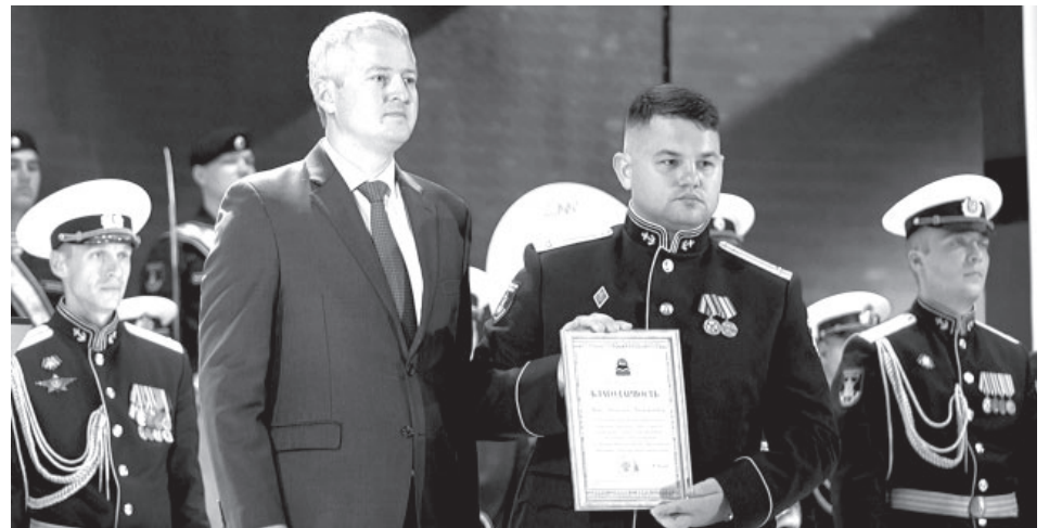
Церемония награждения 40-й бригады морской пехоты

Защита. Военная служба по контракту – возможность осознанно выполнить свой гражданский долг по защите Отечества.