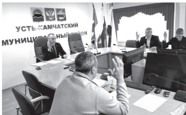
Сессия Собрания депутатов УКСР