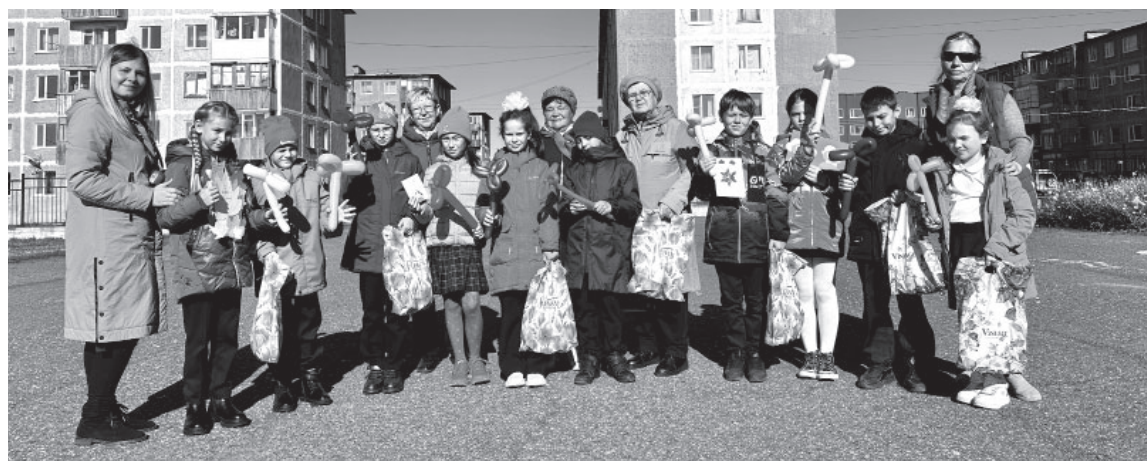
📷 Поздравление пожилых граждан в Усть-Камчатске

В России День пожилых людей отмечают с 1992 года.