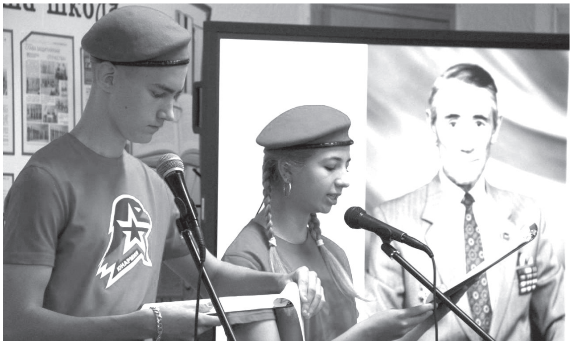
Торжественная линейка в Усть-Камчатской средней школе № 2

Земельный участок можно будет получить для индивидуального жилищного строительства или ведения садоводства, вне зависимости от места жительства (постоянной регистрации) на территории Камчатского края.