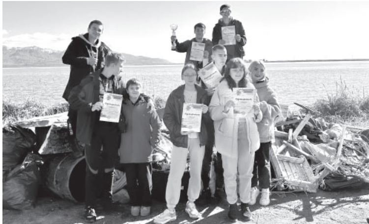
Участники экомероприятия «Чистые игры»

30 сентября к сбору мусора в Усть-Камчатке приступили 15 команд, на территории, где проходили игры, можно было