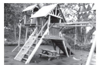
Детская площадка в п. Ключи

Для этого было приобретено новое игровое оборудование, положено резиновое покрытие, установлены качели и многое другое, теперь у детей появилось своё пространство для физического, социального, эмоционального и познавательного развития. Финансовая часть проекта составляла 3,5 млн рублей, выделенных из бюджетов края и поселения. Установку и монтаж детского игрового оборудования производила МУП «Ключевская управляющая компания».