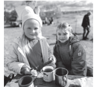
День туризма в Козыревске