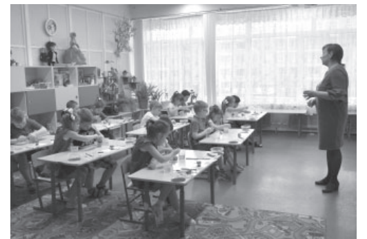
Детский сад п. Усть-Камчатска «Снежинка»

Коллектив детсада участвует в общепоселковых конкурсах и проектах, а также в культурно-массовых мероприятиях – «День ходьбы», «День пожилого человека», «Праздник Весны и Труда», «День Победы».