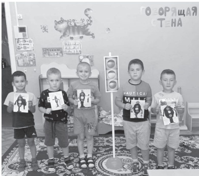
Воспитанники детского сада «Ёлочка» п. Ключи