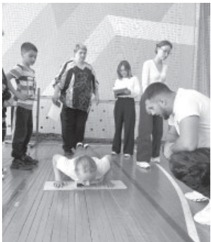
📷 Сдача нормативов ГТО в п. Усть-Камчатске

15 и 16 сентября в Усть-Камчатке проходил осенний этап сдачи нормативов ВФСК «ГТО». 15 сентября нормативы сдавали дети до 18 лет. На торжественной части спортивного мероприятия местных футболистов наградили за участие в региональном этапе всероссийских соревнований юных футболистов «Кожаный мяч». Затем для участников прошла разминка и инструктаж. После этого началась сдача нормативов. В спортивном мероприятии приняли участие около 200 человек до 18 лет. Юные спортсмены сдавали нормативы по всеобщей подготовке – подтягивание на перекладине, метание, челночный бег, прыжки в длину, отжимания, пресс. На следующий день участие в сдаче приняло взрослое население Усть-Камчатка. Спортсмены также сдавали нормативы по всеобщей подготовке.