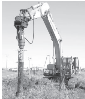
Работы по установке опор освещения

Об этом сообщили в подрядной организации. Работники ООО «Онтарион» провели бурение свай для дальнейшей установки 45 опор. По их словам, это самый сложный этап, в ходе исполнения которого возникали небольшие трудности. Новая линия уличного освещения появится на протяжении 1,1 километра. Заказчиком выступает КГКУ «Камчатуправтотдор». Срок окончания работ – 31 октября 2023 года.