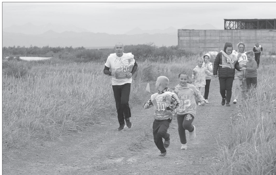
📷 Участники «Кросса нации - 2023» в посёлке Усть-Камчатск

Спорт. В минувшие выходные жители Усть-Камчатского района приняли участие в забеге «Кросс нации – 2023».