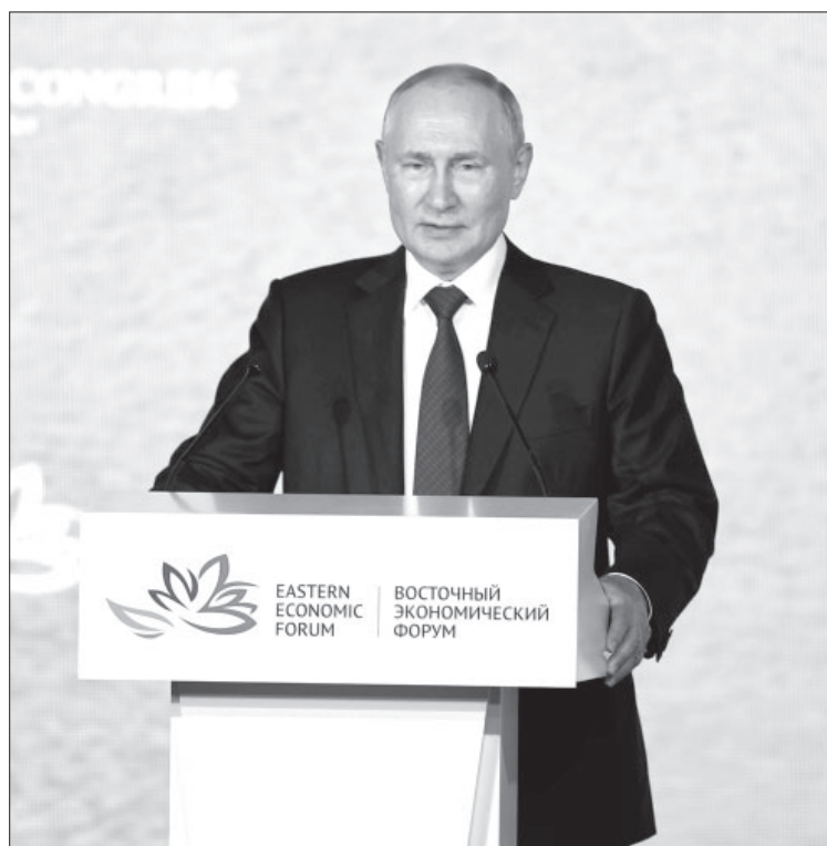
Выступление Владимира Путина на Восточном Экономическом Форуме

Форум собрал во Владивостоке порядка 2400 представителей российского и иностранного бизнеса из более чем 1000 компаний. Состоялось более 100 сессий. Форум стал площадкой