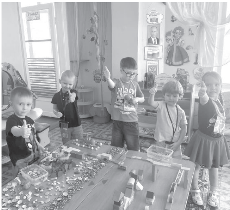
Воспитанники детского сада «Золотой ключик» п. Ключи