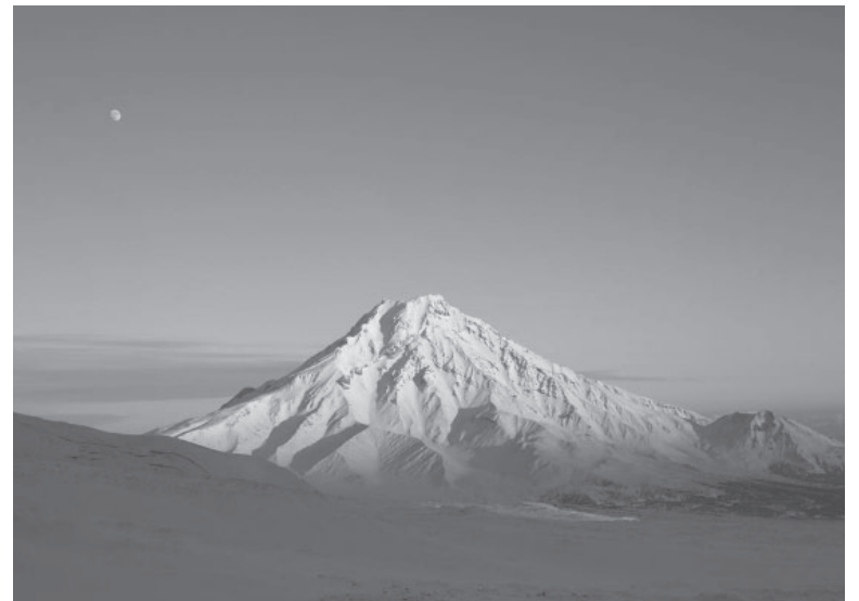
Вулкан «Толбачик»

Опасными соседями – вулканами – можно любоваться прямо из окон домов в любом поселении Усть-Камчатского района. Природа здесь проявляет себя во всей красе: горы, океан, реки, леса. Кроме того, район славится богатой флорой и фауной.