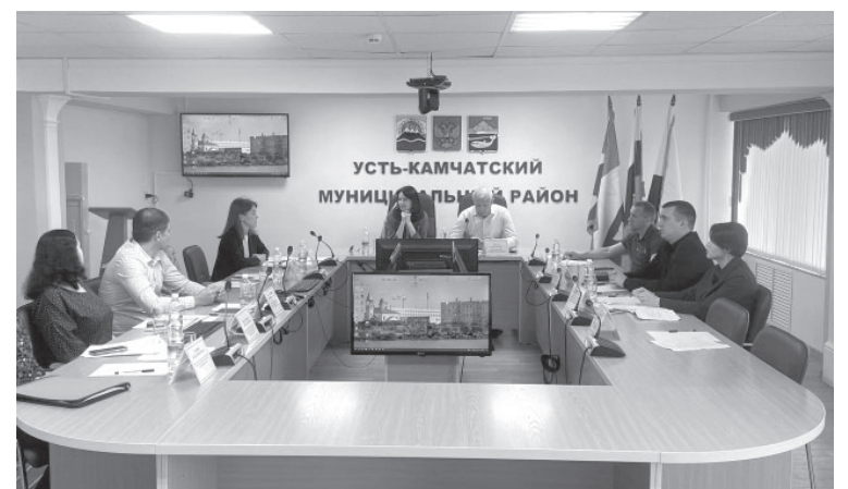
Встреча с предпринимателями