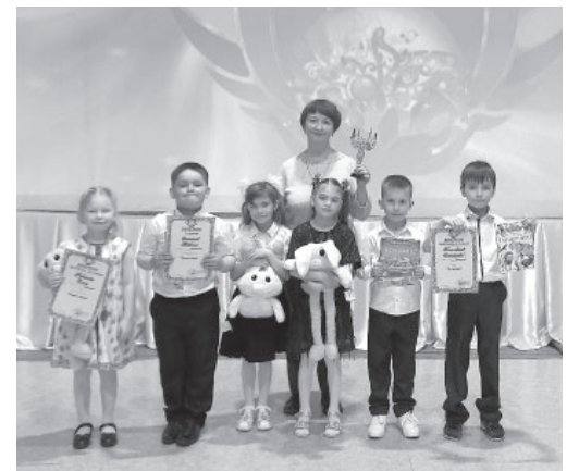
Детский сад п. Козыревска «Солнышко»