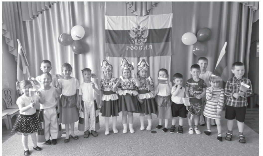
Детский сад п. Усть-Камчатска «Ромашка»

В 2022 году детскому саду был вручён Памятный знак Камчатского края «В память 15-летия Камчатского края».