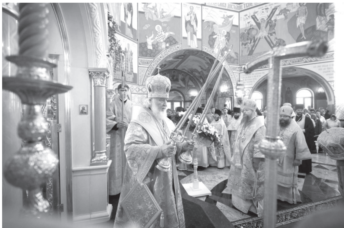
Проповедь после Литургии в Камчатском Морском соборе.

Церковь. Святейший патриарх Московский и всея Руси Кирилл посетил Камчатку.