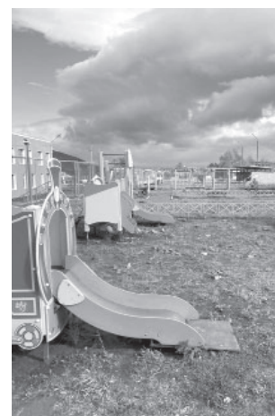
Территория детского сада «Ёлочка» после ремонтно-восстановительных работ по ликвидации последствий схода грунта