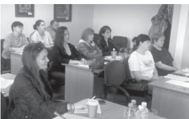
Предприниматели Усть-Камчатка

- Подобные круглые столы благотворно влияют на нашу дальнейшую деятельность, поэтому мы благодарим и министерство экономразвития, и администрацию нашего района за организацию таких встреч и возможности обратной связи, - отметили усть-камчатские и ключевские предприниматели.