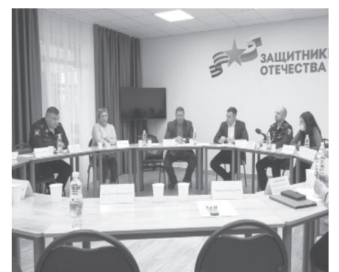
📷 Встреча с семьями участников СВО