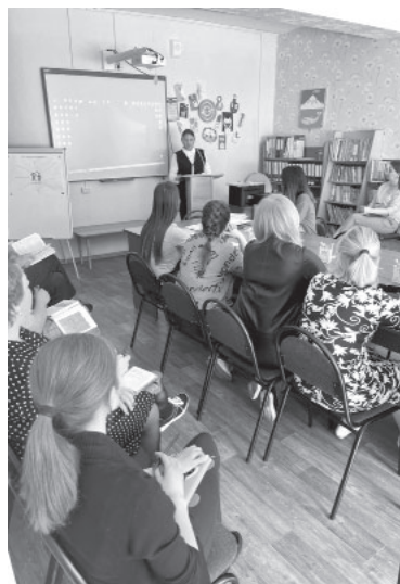
Воспитатели детского сада «Золотой ключик»

В этом году на празднование Дня дошкольного работника коллектив приглашён на торжественное мероприятие в Центр досуга и культуры п. Ключи, а также принимает видеопоздравления от своих воспитанников и их родителей.