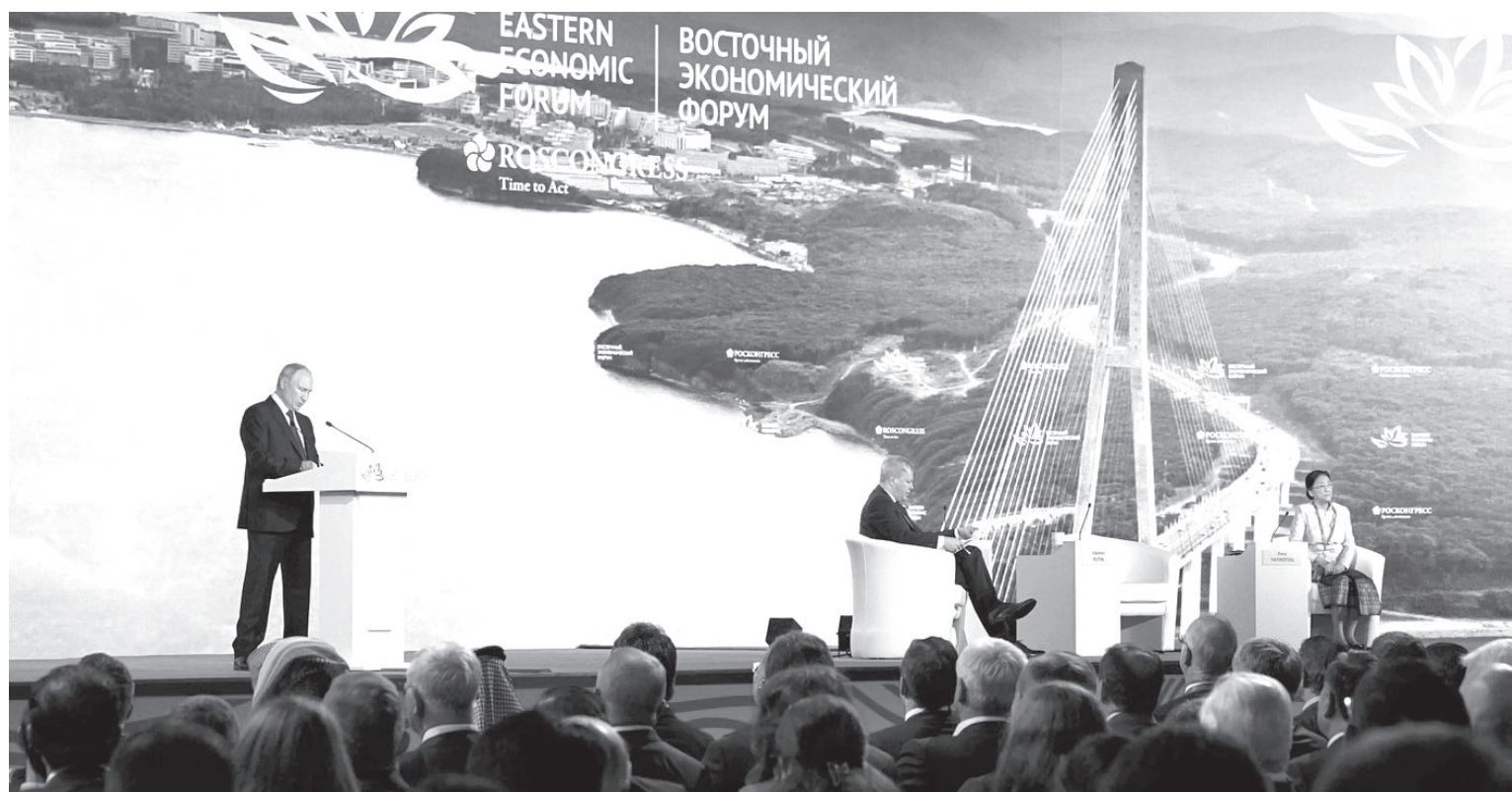
Выступление Владимира Путина на Восточном Экономическом Форуме