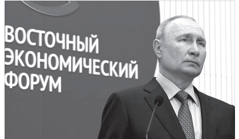
Президент России В. В. Путин

Каких результатов удалось достичь в регионе, добиться за последние десять лет. Прежде всего это касается экономики. Для развития промышленных комплексов и высокотехнологичных производств, для создания новых рабочих мест на Дальнем Востоке были предложены особые налоговые, административные и таможенные преференции, строительство инфраструктуры, подведение сетей к индустриальным площадкам.