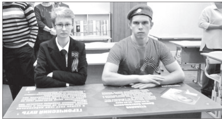
«Парта Героя» в СШ № 6 п.Козыревска

16 февраля 2023 года героически погиб при выполнении боевых задач в г. Угледар Донецкой народной республики. За проявленный героизм, мужество и отвагу награждён ор-