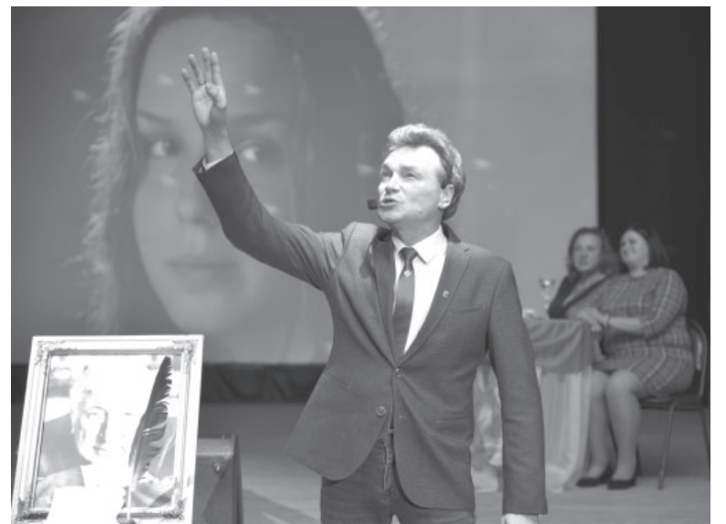
Выступление на вечере памяти поэта

Подобное мероприятие впервые состоялось в Усть-Камчатке. Но сотрудники Центра культуры и досуга не собираются на этом останавливаться. Впереди у них много новых творческих проектов и идей.