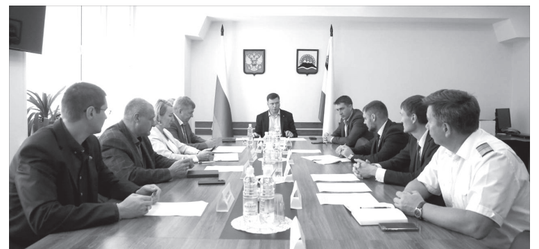
📷 Глава района на совещании в краевом Заксобрании

Расчёт объёма дотации проведёт краевое министерство транспорта, после чего вопрос вновь рассмотрят в Законодательном собрании.