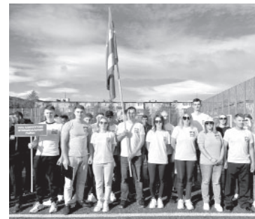
Сборная Усть-Камчатского района на региональном этапе летних сельских игр

Интересно, что по итогам регионального этапа соревнований, проходившего в течение трёх дней, будет сформирована сборная команда из самых сильных участников этих игр, которая отправится защищать честь Камчатского края на Всероссийском этапе летних сельских спортивных игр.