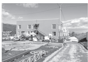
📷 Ремонт детсада в п. Ключи