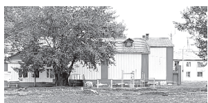
Будущая зона отдыха в п. Козыревск

В голосовании приняли участие уже 1400 человек. Из них 596 жителей отдали свой голос за хоккейную площадку в Козыревске, 479 – за парк в Ключах, 109 – за детскую площадку в Крутоберёгове, 86 – за зимнюю горку в Ключах, по 65 голосов отдано за освещение и парк возле храма в Усть-Камчатске. Голосование будет проходить по 30 сентября 2023 года на сайте: voting.vporyadke41.ru .