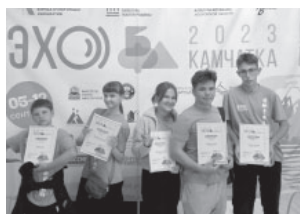
Участники из Усть-Камчатского района

Стартовал фестиваль на сцене Камчатского театра драмы и комедии показом музыкальной сказки «Маленький принц» Московского Губернского театра. Режиссер и исполнитель главной роли - народный артист России, художественный руководитель Московского Губернского театра Сергей Безруков. Кроме того, в рамках фестиваля прошли встречи с известными детскими писателями, мастер-классы по актерскому мастерству, тренинги по театральной режиссуре и сценическому движению. Участие в Большом Детском фестивале «ЭХО БДФ - Камчатка» было для учеников незабываемым и ценным опытом.