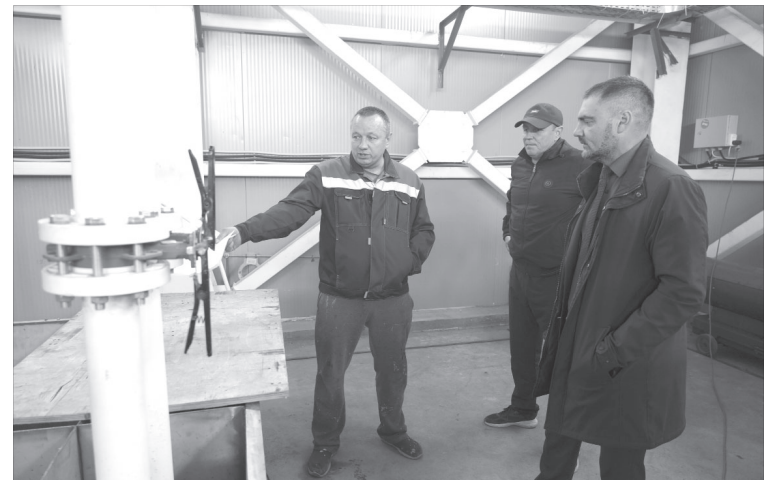
📷 Глава района на новых очистных сооружениях в Усть-Камчатске

На заседании решено привлечь виновных к ответственности и оперативно продолжить работу по возведению жилого дома.