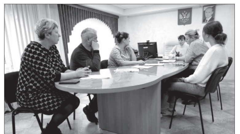
☒ Заседание комиссии по выбору управляющих компаний

- Мы, как организаторы аукциона, были обязаны согласиться с решением собственников и снять данные пятиэтажки с торгов. Соответственно, те дома, которые находились в лоте вместе с ними,