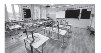
Обновленный класс СШ № 6

За летний период в здании дополнительного образования проведён капитальный ремонт системы холодного водоснабжения и системы отопления. Выполнен косметический ремонт в учебных классах и коридорах. Так же полностью обновлена учебная мебель. Напомним, к началу нового учебного года в РФ будет отремонтировано почти 1,3 тысячи школ, также ещё почти 500 школ отремонтируют до конца года, заявил президент РФ Владимир Путин.