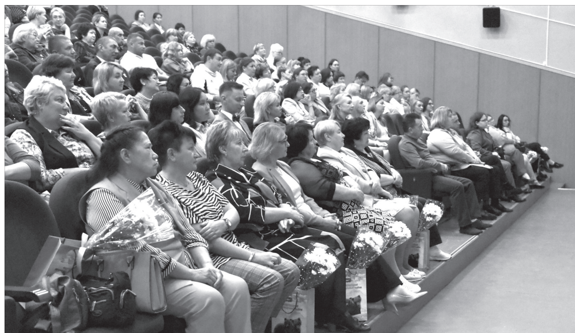
■ Пленарное заседание августовского совещания педагогов Усть-Камчатского района

Образование. Преподаватели Усть-Камчатского района обсудили достижения и перспективы развития муниципальной системы образования.