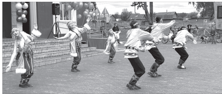
Выступление ансамбля «Нулгур»

После этого началась развлекательная часть. Для гостей выступил эвенский национальный ансамбль «Нулгур» из села Эссо. Зрители с удовольствием смотрели музыкальные номера, ведь каждое движение в национальных танцах неслучайно. Через танец и голосовое сопровождение можно познаться с характерными чертами каждого