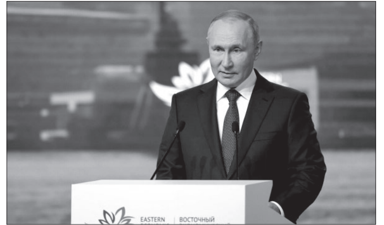
☒ Президент России В. В. Путин

Поэтому он анонсировал продление дальневосточной ипотеки со ставкой 2% до 2030 г. К этому сроку планируется ввести около 2,5 млн кв. м жилья, построить на Дальнем Востоке 10 000 арендных квартир для молодых специалистов, которые будут сдаваться по цене ниже рыночной за счёт субсидий. Он