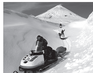
Отряд Камчатской вулканостанции выехал на полевые работы на сейсмостанцию Апахончич