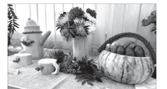
Выставка цветов и овощей