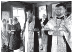
☒ Божественная праздничная литургия

После этого был совершён крестный ход со всеми прихожанами на р. Радугу, где священнослужители совершили водосвятный молебен, после чего всех окропили новоосвященной водой.