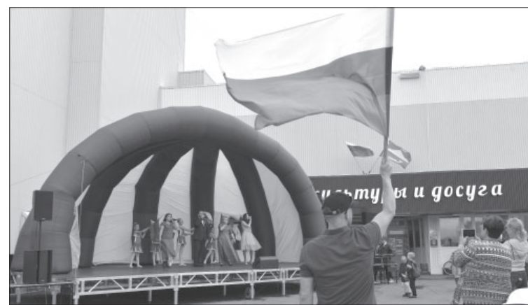
☉ День флага РФ в п. Усть-Камчатске, 2022 год

А в Козыревской библиотеке 22 августа пройдут сразу три мероприятия – информационная беседа «Триколор моей России – знак свободы и любви», книжная выставка «Флаг державы нашей» и беседа «Гордо реет флаг России».