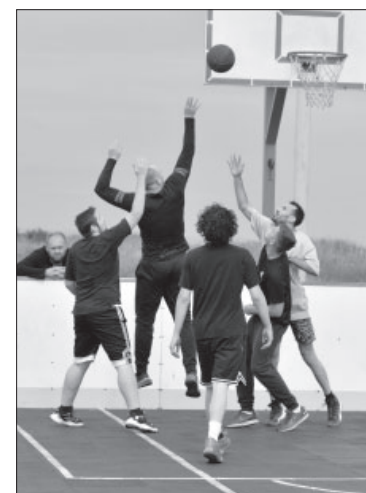
☉ Матч по стритболу в п. Усть-Камчатске