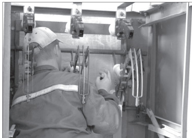
Ремонт электрооборудования в ТП-57