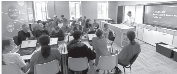
Тренинг в ДОЛ им. Гагарина

дыхать в загородном лагере им. Гагарина в смене «Время Первых».