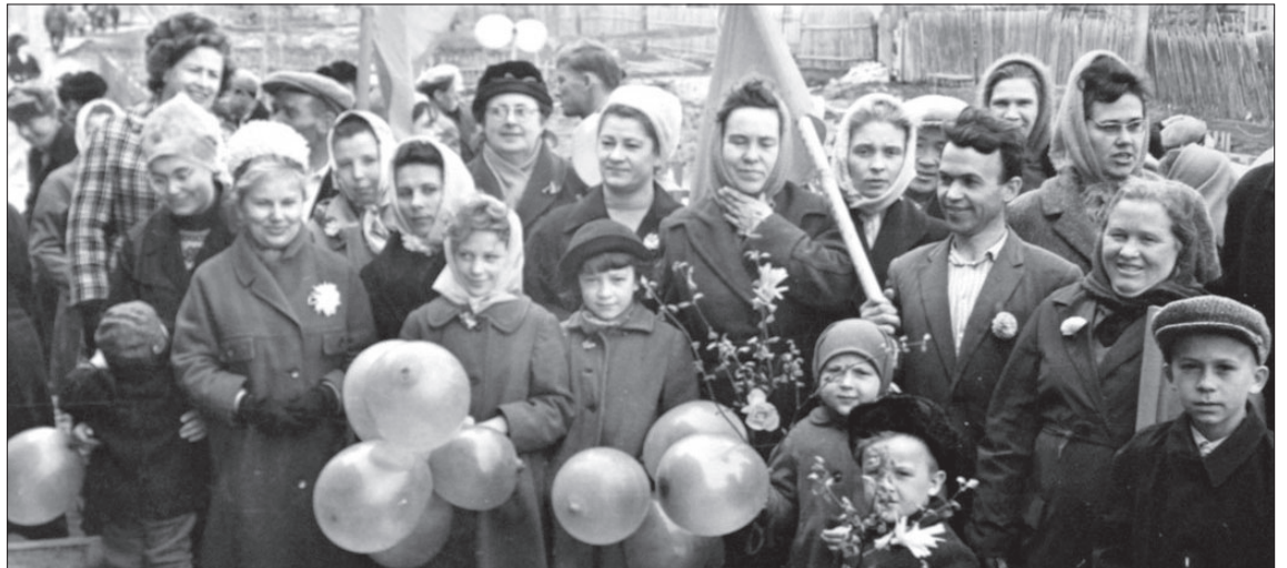
■ Группа жителей п. Козыревска на Первомайской демонстрации. Начало 1970-х