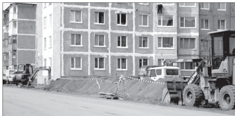
Ремонт трубопровода холодного водоснабжения