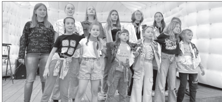
Мероприятие в честь закрытия ДОЛ «В сопках»

Но не у всех усть-камчатских школьников отдых подошёл к концу. До 30 августа девять учащихся школы № 2 будут от-