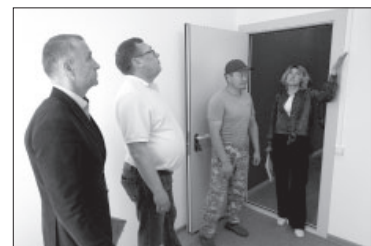
Приёмка выполненных работ по капитальному ремонту почтового отделения №4