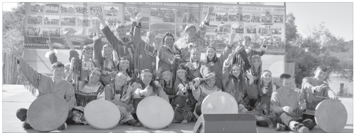
Приглашённые ансамбли «Алгу» из с. Соболева и «Нулгур» из с. Эссо

После официальной части на поляне КМНС началась развлекательная программа. Маленькие гости могли принять участие в детской программе со множеством игр, конкурсов. С малышами работали аниматоры, которые дружно и весело танцевали с участниками, помогали им во время прохождения состязаний. В организации игр приняли участие сотрудники спортивной школы Усть-Камчатского района,