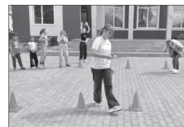
☉ «Весёлые старты» в п. Козыревске