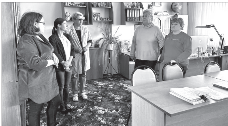
Приёмка детского сада «Ромашка» в п. Усть-Камчатске

В соответствии с постановлением Главы Усть-Камчатского района с 9 по 11 августа проводились муниципальные комиссии по проверке готовности образовательных организаций к новому учебному году.