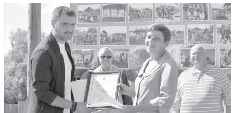
Награждение на Дне аборигена в п. Ключи

По заведённому обычаю на празднике состоялась гонка на батах. Участие принимали пять