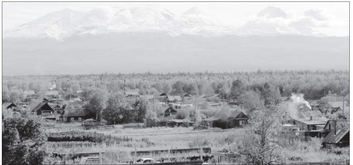
■ Вид на п. Козыревск. Начало 2000-х

Камчатке. В дальнейшем детально будет рассматриваться вопрос о продовольственном снабжении и перевозимых средствах. Для запечатления памяти съезда президиум с участниками был сфотографирован».