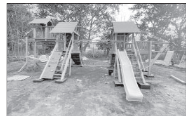
Монтаж детской игровой площадки в п. Ключи

Приобретено новое игровое оборудование и выполнен его монтаж. В настоящее время ведётся подготовка к укладке резинового покрытия на площадку. Финансовая часть проекта составляет 3,5 млн рублей, выделенных из бюджетов края и поселения. Исполняет контракт МУП «Ключевская управляющая компания». Напомним, президент Владимир Путин считает, что только вместе можно сделать всё необходимое, чтобы уровень благоустройства городов и посёлков соответствовал ожиданиям наших граждан.