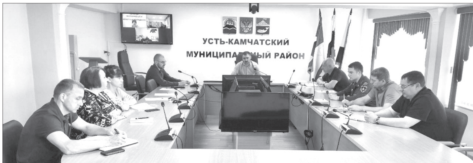
ФОТО: Заседание комиссии по чрезвычайным ситуациям Усть-Камчатского района

Повышенная готовность. Такое решение принято 28 июля на заседании районной КЧС.