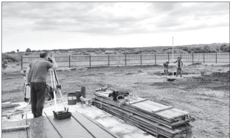
Строительство фельдшерского здравпункта в Крутоберёгове

Нацпроект. Строительство фельдшерского здравпункта в Крутоберёгове войдёт в финальную стадию.