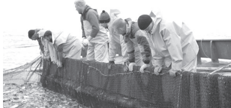
Сводка предоставлена администрацией Усть-Камчатского муниципального района.