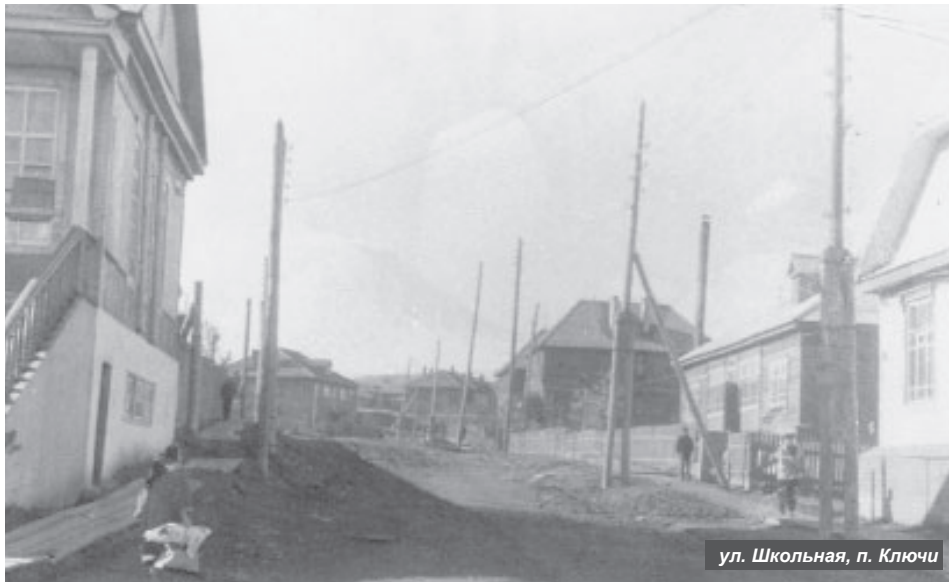
ул. Школьная, п. Ключи

за оленеводческого хозяйства, школа, ясли. Село находится на ровном месте между сопками, окружающих село с трёх сторон. В сопках пасутся олени. В конце села – горячие ключи».