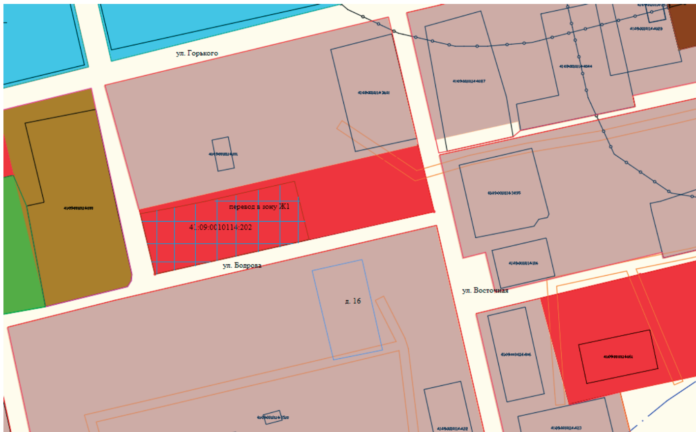
Каталог координат границ переводимой территориальной зоны

Территория, переводимая в территориальную зону: Зона общественно-деловая комплексная (ОДК) из территориальной зоны: Зона смешанной малоэтажной жилой застройки (Ж1)