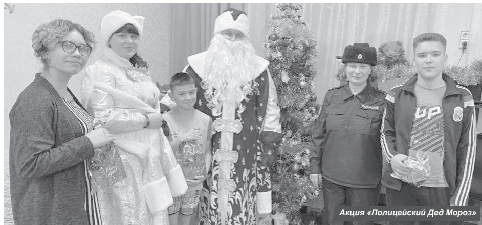
Акция «Полицейский Дед Мороз»

3 января в Центре дополнительного образования детей п. Усть-Камчатка состоялась квест-игра «Новогодний детектив». Несмотря на ветреную и снежную погоду, ребята активно принимали участие и разгадывали различные головоломки. А в канун Рождества Христова