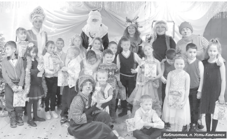
Библиотека, п. Усть-Камчатка