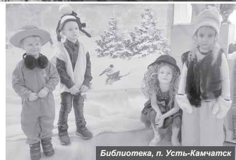
Библиотека, п. Усть-Камчатка

там прошло семейное мероприятие для дошколят «Рождественское чудо». Ребята вместе с родителями дружно водили хороводы, танцевали, получали рождественские сказания. Праздник завершился чаепитием со сладкими пирогами.