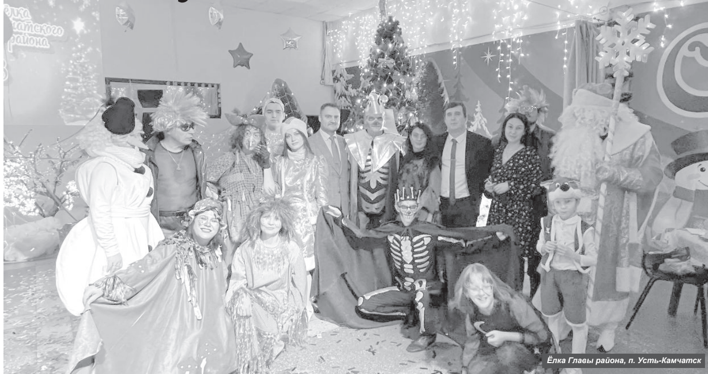
Ёлка Главы района, п. Усть-Камчатск

С конца декабря в Усть-Камчатском районе состоялось огромное количество праздничных мероприятий.