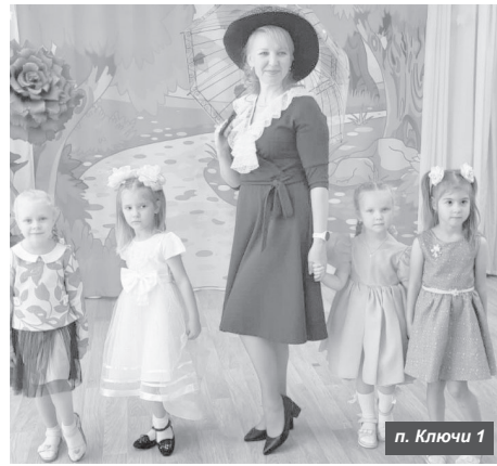
п. Ключи 1

Небольшой концерт и награждение! Коллективы детских садов «Снежинка» п. Усть-Камчатска и «Золотой ключик» п. Ключи-1 отметили День дошкольного работника.