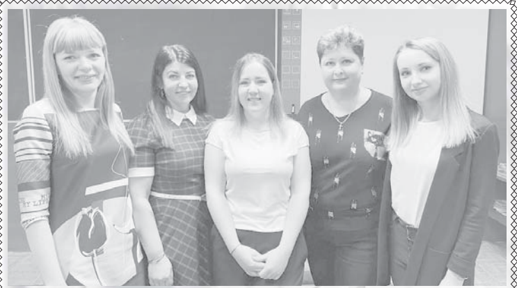
Милые, добрые и очаровательные, наши чудесные женщины! Пусть всё невозможное для вас станет возможным, а жизнь будет полна приятных сюрпризов и радостных событий. Больше романтики, нежности и любви пожелаем вам в праздник 8 Марта! Будьте здоровы и чаще улыбайтесь.

- На официальном сайте торгов Российской Федерации - www.torgi.gov.ru. В Управлении имущественных и земельных отношений администрации Усть-Камчатского муниципального района по адресу: 684415, Камчатский край, Усть-Камчатский район, п. Усть-Камчатск, ул. 60 лет Октября, 24, тел. 8 (415-34) 2-07-02 доп. 253; 3 этаж, каб. 4.1 (режим работы: понедельник - четверг с 09.00 до 18.00; пятница с 09.00 до 13.00; обед с 13.00 до 14.00) с момента официального опубликования настоящего Извещения до даты окончания срока подачи заявок.