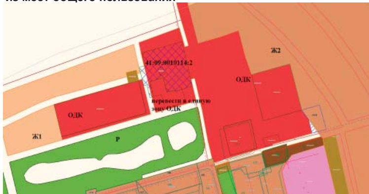
Каталог координат границ переводимой территориальной зоны