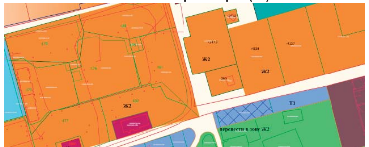
Каталог координат границ переводимой территориальной зоны

Территория, переводимая в территориальную зону: Зона среднеэтажной жилой застройки (Ж2) из территориальной зоны: Зона автомобильного транспорта (Т1)