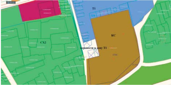
Каталог координат границ переводимой территориальной зоны

Территория, переводимая в территориальную зону: Зона автомобильного транспорта (Т1) из зоны общего пользова- ния