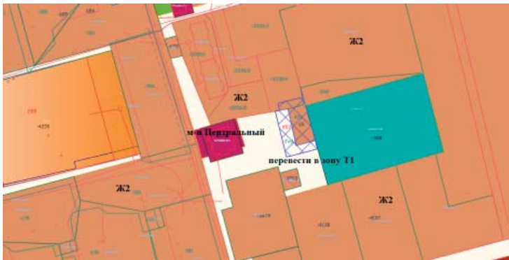
Каталог координат границ переводимой территориальной зоны

Территория, переводимая в территориальную зону: Зона автомобильного транспорта (Т1) из территориальной зоны: Зона среднеэтажной жилой застройки (Ж2), мест общего пользования