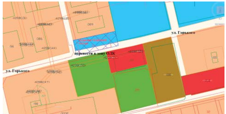
Каталог координат границ переводимой территориальной зоны

Территория, переводимая в единую территориальную зону: Зона общественно-деловая комплексная (ОДК) из зоны общего пользования