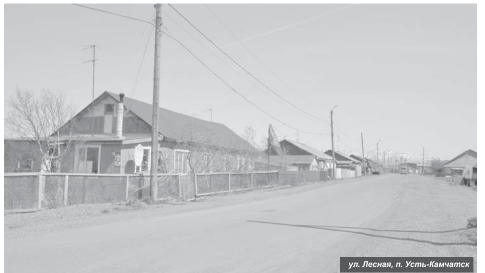
ул. Лесная, п. Усть-Камчатск