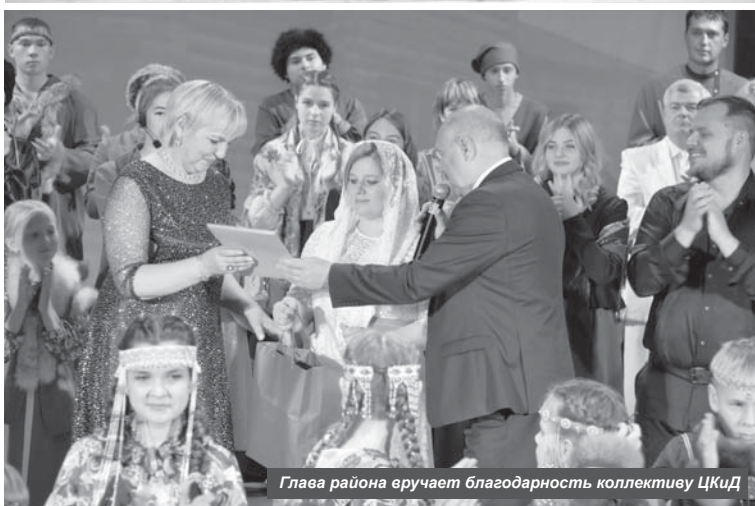
Глава района вручает благодарность коллективу ЦКиД