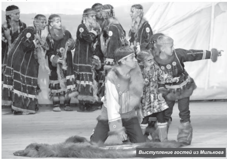
Выступление гостей из Милькова