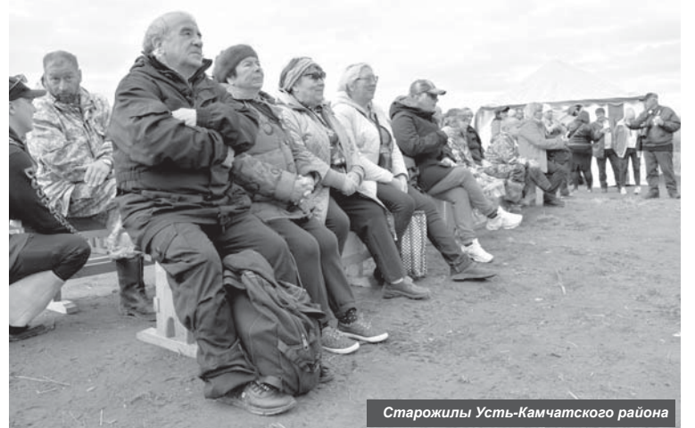
Старожилы Усть-Камчатского района