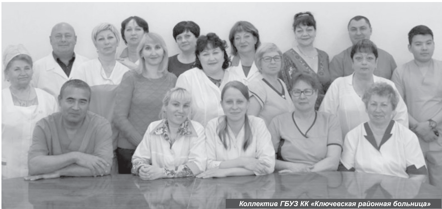
Коллектив ГБУЗ КК «Ключевская районная больница»

В этом выпуске мы решили рассказать вам, уважаемые читатели, о деятельности государственного бюджетного учреждения здравоохранения Камчатского края «Ключевская районная больница», а также о работе медучреждений нашего района в период пандемии из-за коронавируса и праздновании Дня медицинского работника.