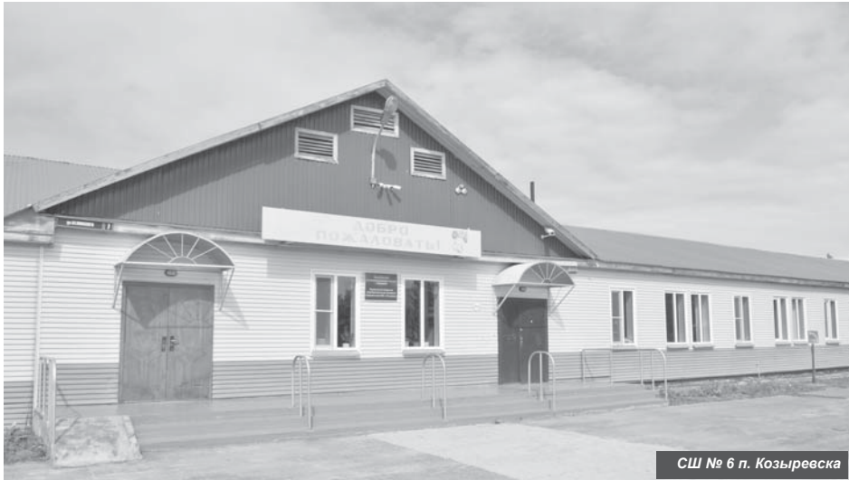
ССШ № 6 п. Козыревска

идеями на районных семинарах, в индивидуальном порядке при проведении консультаций для родителей и детей, участвуют в конкурсах профессионального мастерства.