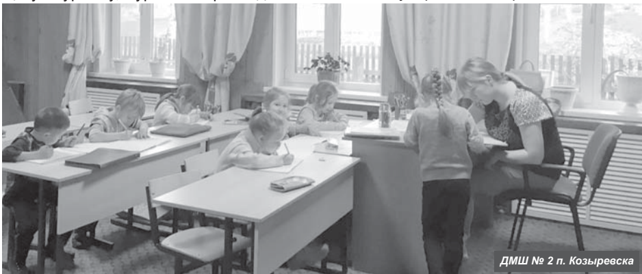
ДМШ № 2 п. Козыревска