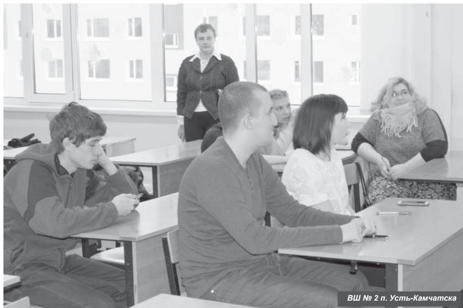
ВШ № 2 п. Усть-Камчатка

5 октября в России отмечают День учителя, поэтому в этом выпуске предлагаем вам узнать о педагогических работниках общеобразовательных школ, филиала «Камчатского индустриального техникума», вечерней школы Усть-Камчатского района, а также учреждений дополнительного образования детей.