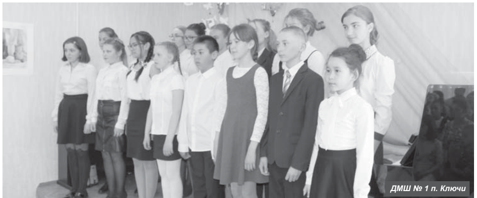
ДМШ № 1 п. Ключи