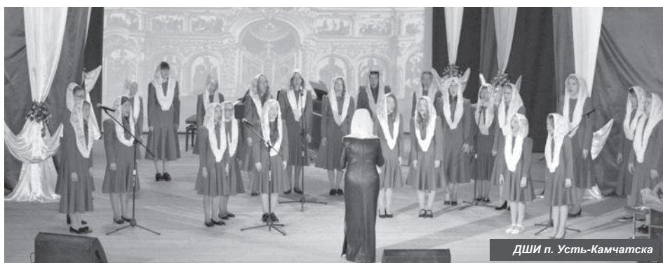
ДШИ п. Усть-Камчатка

Коллектив ЦДОД работает творчески, находится в поиске наиболее эффективных путей повышения качества обучения, воспитанности учащихся. Экспериментируют, осваивают новые информационные технологии, используют в процессе обучения электронные пособия по программам. Они охотно делятся опытом и наработками на открытых уроках, своими