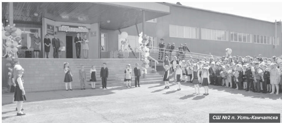
СШ №2 п. Усть-Камчатка

В праздничный день школы планируется провести День самоуправления, также хотелось бы отметить, что в этом