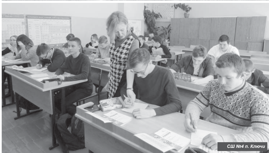
СШ №4 п. Ключи

году учебное заведение в Усть-Камчатке празднует свой 60-летний юбилей.