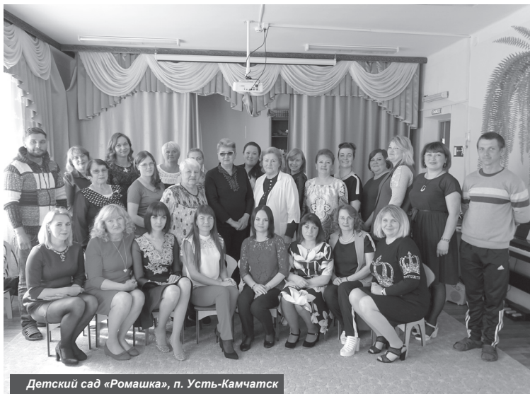
Детский сад «Ромашка», п. Усть-Камчатск