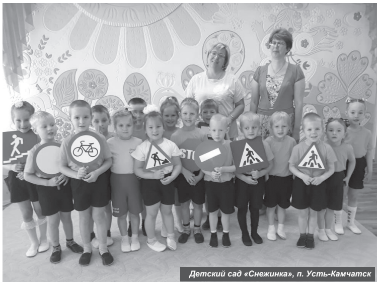
Детский сад «Снежинка», п. Усть-Камчатск

День дошкольного работника 27 сентября отметят сотрудники детских садов Усть-Камчатского района. В связи с этим праздничным событием мы хотим вам рассказать о людях, которые посвятили свою жизнь воспитанию малышей.