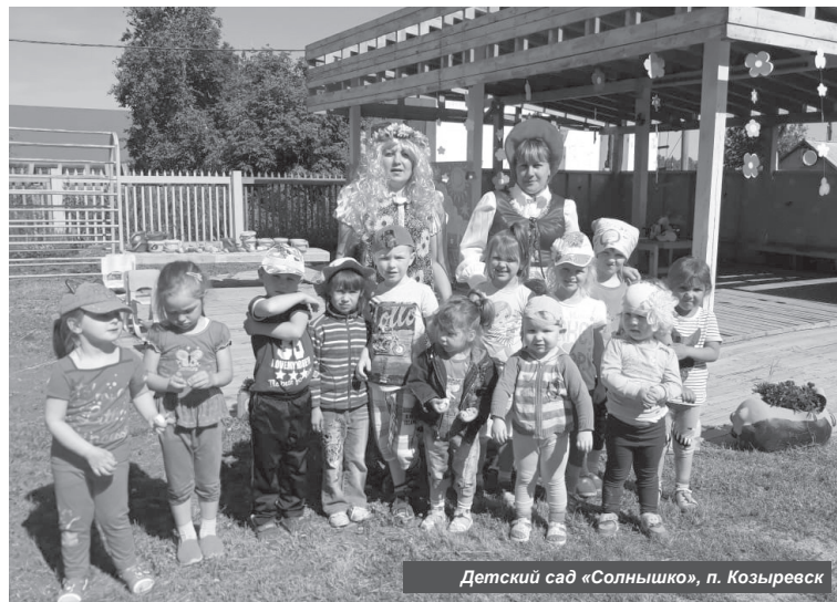
Детский сад «Солнышко», п. Козыревск

Дошкольное учреждение № 17 «Золотой петушок» — один из самых старейших в нашем районе детский сад. Он был основан в 1961 году. Но спустя 20 лет сад был переведён в новое здание, в которое по сей день родители водят своих детишек.