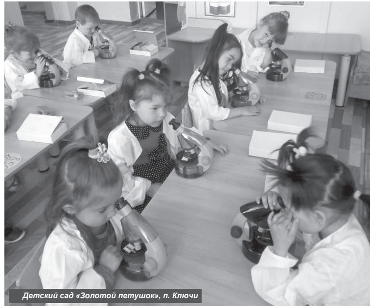
Детский сад «Золотой петушок», п. Ключи