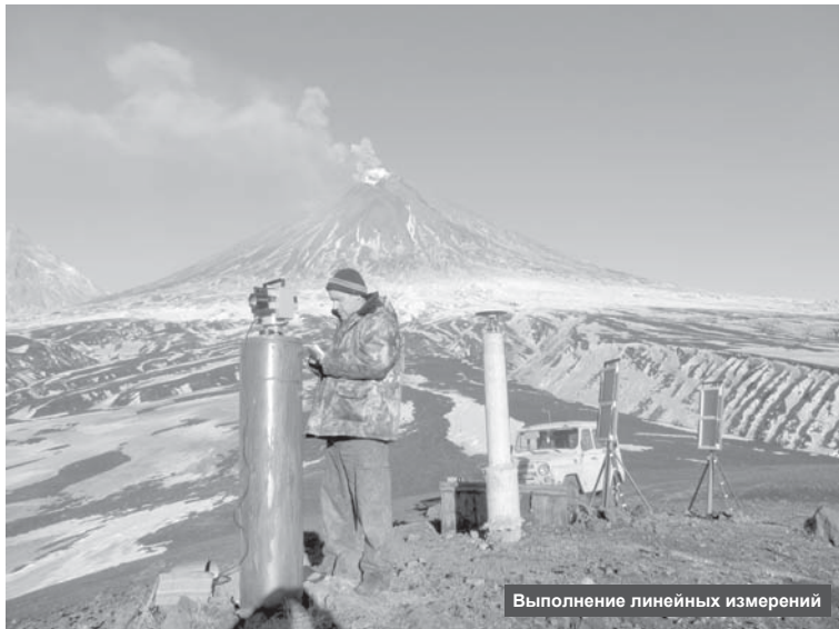
Выполнение линейных измерений

Свои двери она открыла в 1935 году в первый день осени возле домашней группы вулканов Усть-Камчатского района. Эту дату и принято считать днём рождения советской вулканологии.