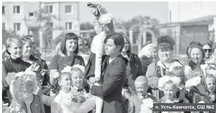
п. Усть-Камчатка, СШ №2