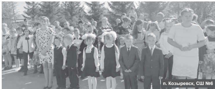
п. Козыревск, СШ №6