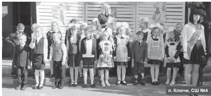
п. Ключи, СШ №4