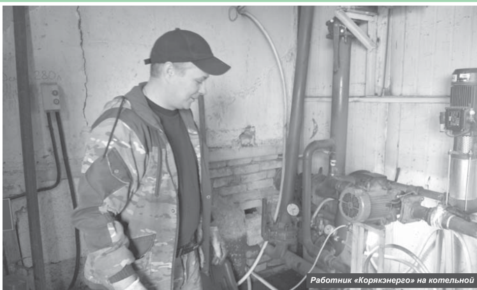
Работник «Корякэнерго» на котельной

– АО «Корякэнерго» готова принимать сведения радиаторных распределителей в домах 4а, 4б, 35 и 35а по ул. 60 Октября для поквартирного учёта расхода тепловой энергии. На общем собрании соб-