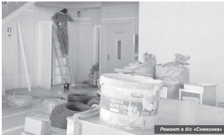
Ремонт в д/с «Снежинка»