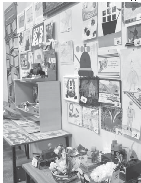
министрации Усть-Камчатского района» С. А. Халко:

Наличие инженерной техники на предприятиях и в организациях, расположенных на территории Усть-Камчатского муниципального района, которые будут задействованы по мере необходимости в случае угрозы и возникновения чрезвычайных ситуаций: автокран – 10 ед., бульдозер – 22 ед., экскаватор – 5 ед., автогрейдер – 11 ед., компрессор – 4 ед., самосвал – 24 ед., погрузчик (фронтальный) – 20 ед., грузовая машина – 10 ед., автобус – 17 ед., трактор – 2 ед., автоманипулятор – 7 ед., автовышка – 2 ед., тягач – 3 ед.