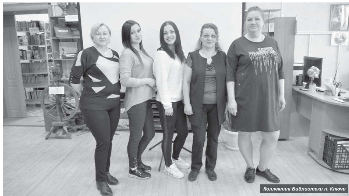
Коллектив Библиотеки п. Ключи

Особенность современной библиотеки заключается в том, что, будучи открытой, общедоступной, она оказывает услуги, стремясь стать центром притяжения общественности.