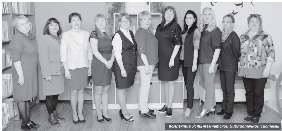
Коллектив Усть-Камчатской Библиотечной системы

27 мая в стране перевернул страничку календаря 24-й Общероссийский день библиотек, и мы хотим рассказать о дворцах литературы Усть-Камчатского района.