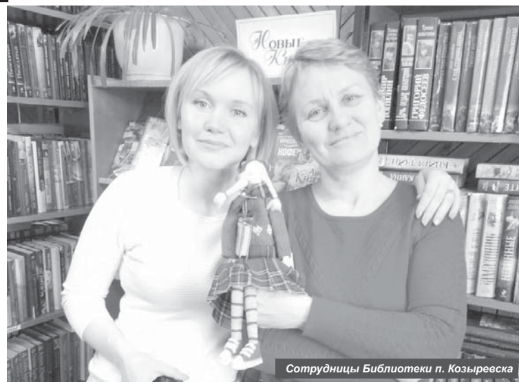
Сотрудницы Библиотеки п. Козыревска

Одним из традиционных направлений в работе учрежде-