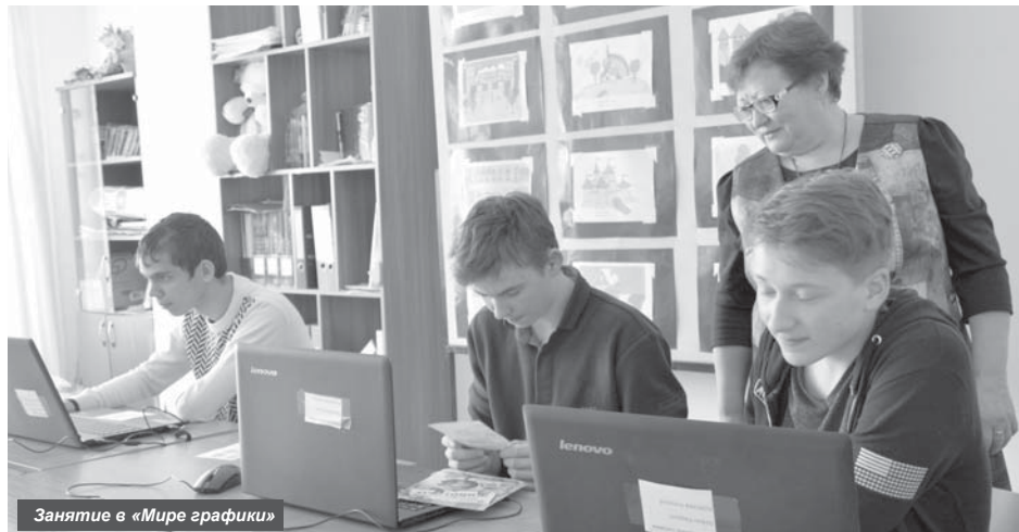
Занятие в «Мире графики»

— Когда был основан ЦДОД, каковы основные виды деятельности?