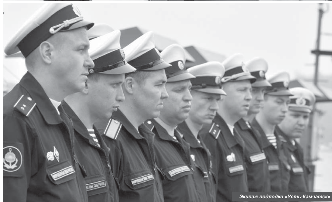
Экипаж подводки «Усть-Камчатск»