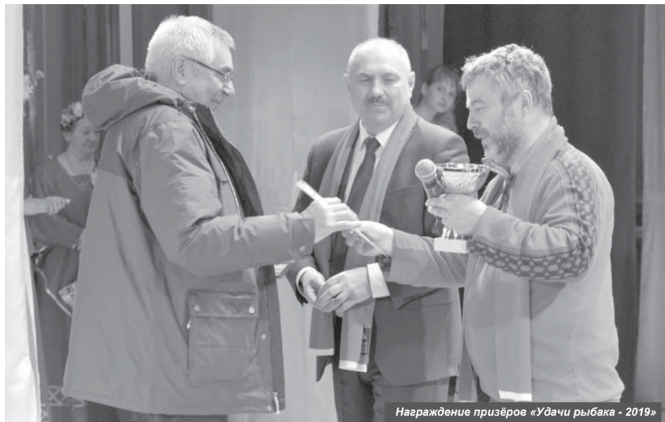
Награждение призёров «Удачи рыбака - 2019»