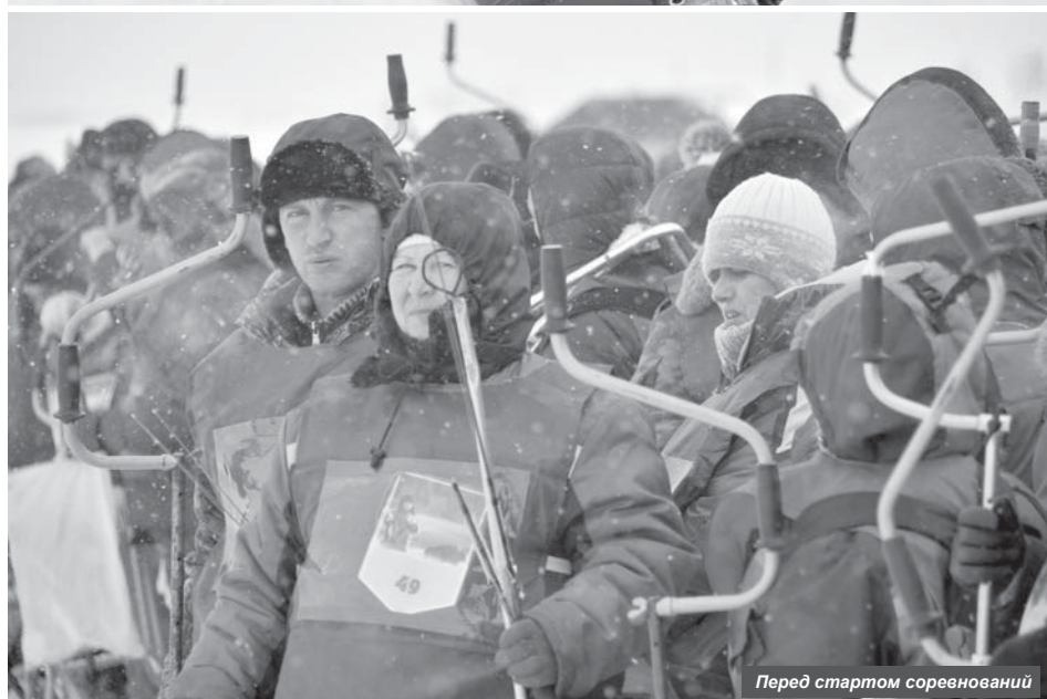
Перед стартом соревнований