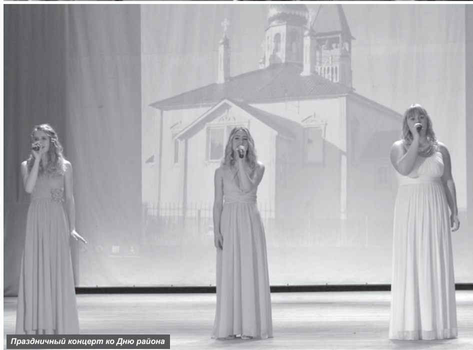
Праздничный концерт ко Дню района