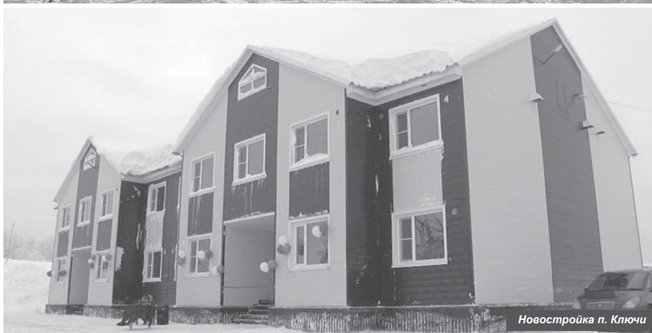
Новостройка п. Ключи