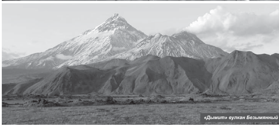
«Дымит» вулкан Безымянный

Снесена часть старых многоквартирных домов и ветхих строений. Ликвидировано девять несанкционированных свалок, в том числе в с. Майском. В Козыревске организована свалка твёрдых бытовых отходов около АЗС. На ул. Советской предприняты меры для отвода талых вод.