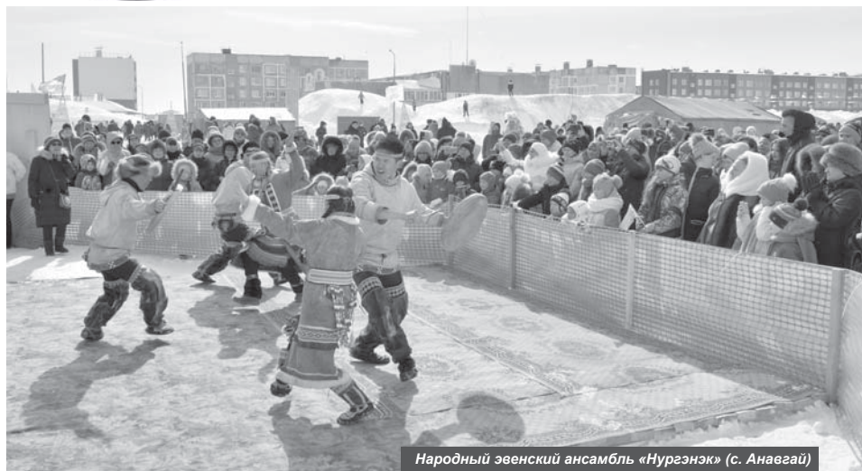
Народный эвенский ансамбль «Нургэнэк» (с. Анавай)