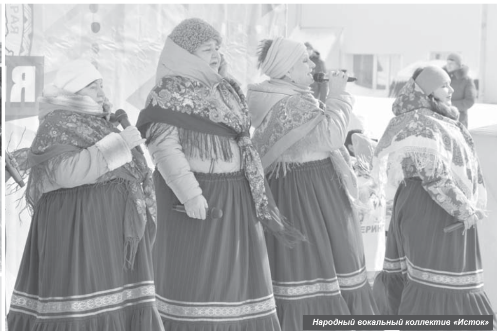
Народный вокальный коллектив «Исток»