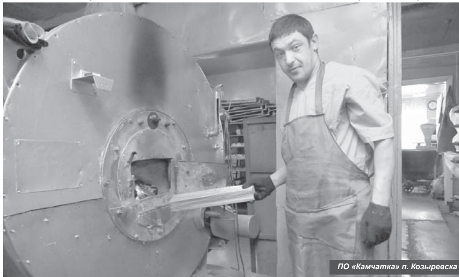
ПО «Камчатка» п. Козыревска

Разработан проект на устройство пирса для забора воды в целях тушения пожаров в п. Козыревске, а также поступила новая автоцистерна.