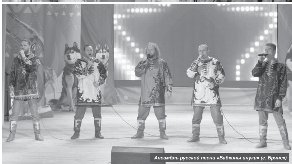
Ансамбль русской песни «Бабкины внуки» (г. Брянск)