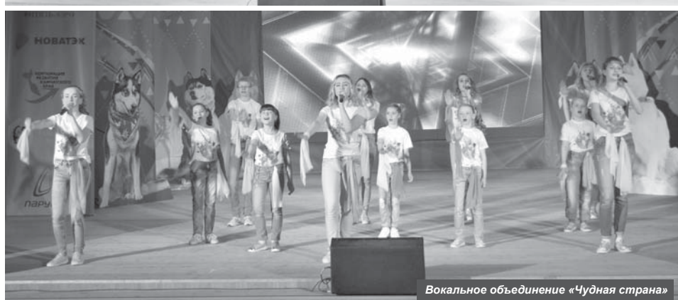
Вокальное объединение «Чудная страна»