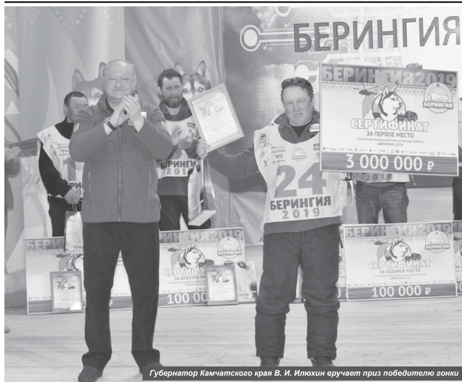
Губернатор Камчатского края В. И. Илюхин вручает приз победителю гонки