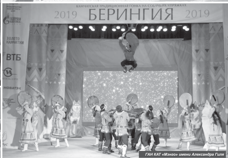
ГАН КАТ «Мэнго» имени Александра Гилы