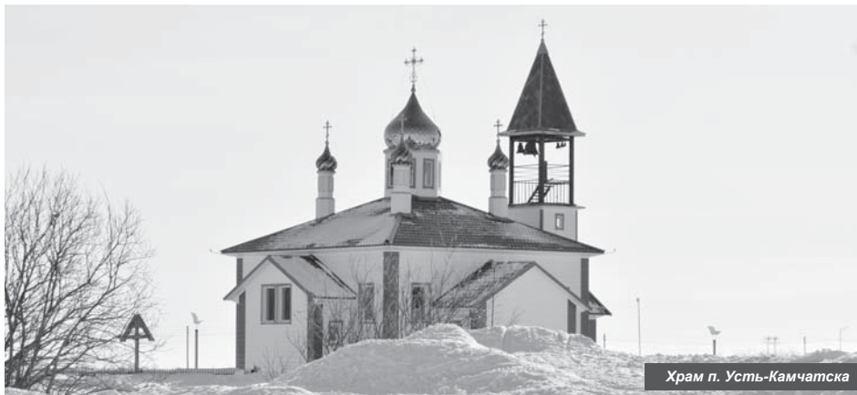
Храм п. Усть-Камчатска

В преддверии Дня Усть-Камчатского муниципального образования мы подвели итоги за 92-ой год жизни нашей малой родины.