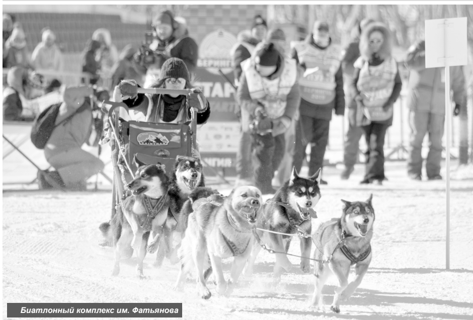
Биатлонный комплекс им. Фатьянова

Торжественная церемония открытия 28-ой камчатской традиционной гонки на собачьих упряжках «Берингия» стартовала.