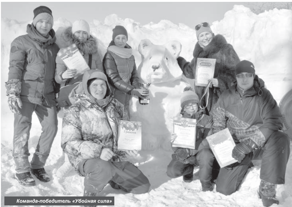
Команда-победитель «Убойная сила»

Активный отдых и отличное настроение подарило устькамчатцам выездное мероприятие «Зимние забавы», оно стало для жителей новинкой.