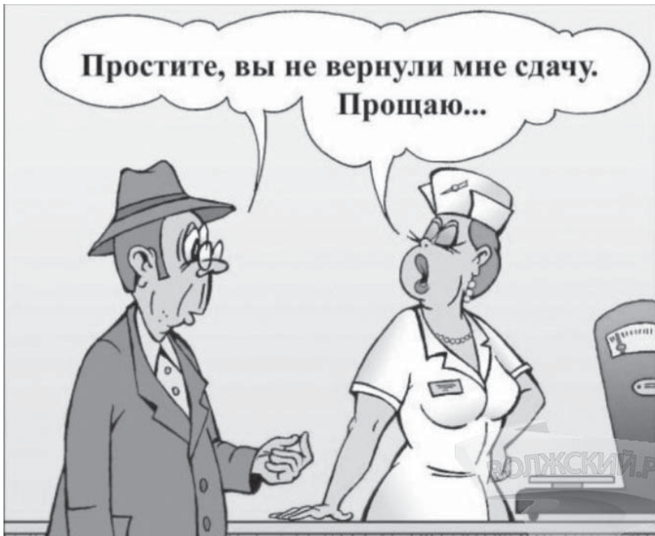
Два плюс два будет пять

Вы купили в магазине продукты, а вместо, допустим, 1 500 рублей, продавец озвучивает более крупную сумму – на 50, 100, а может, и на 500 рублей превышающую итоговую стоимость всего приобретённого. Тут уж всё зависит от наглости работника торговой точки... Знакомая ситуация? Наверняка, да. Но это далеко не единственная схема обмана.