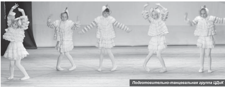
Подготовительно-танцевальная группа ЦДиК